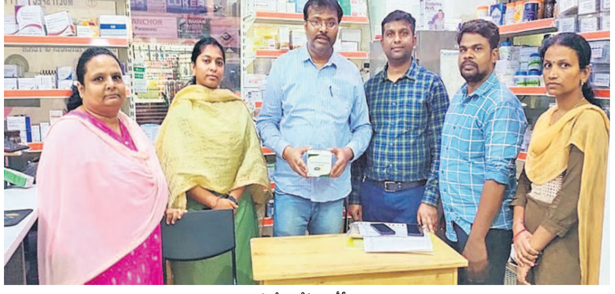
మందుల స్యానిటేషన్ చేసుకున్న డివీసీ అధికారులు

అధిక రేట్లకు విక్రయిస్తున్న శోషణలను డివీసీ అధికారులు సీజ్ చేసి.. తయారీ కంపెనీలకు నోటీసులు జారీ చేశారు. 'ట్రాకాజోల్ క్యాప్సుల్స్-200 ఎంజీ' పది మాత్రల ధర అన్ని రకాల వస్తువులతో కలిపి రూ. 247.75కు విక్రయించాలి. కానీ 'సెక్విక్' అనే శోషణ తయారీ కంపెనీ నిబంధనలకు విరుద్ధంగా 10 మాత్రలను రూ. 298కి విక్రయిస్తోంది. అంటే ప్రతి 10 మాత్రలపై రూ. 50.30 అధికంగా మూల్యం చేస్తోంది. సమాచారం అందుకున్న డివీసీ అధికారులు శావీరపేటలోని పలు మెడికల్ షాపులపై దాడులు జరిపి.. అధిక ధరలకు విక్రయిస్తున్న శోషణలను సీజ్ చేసి, తయారీ కంపెనీ 'సెక్విక్'కు నోటీసులు జారీ చేశారు.