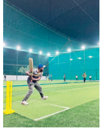
నెట్లో క్రికెట్ ఆడుతూ..

ఎక్కువమంది ఇష్టపడే ఆటలో క్రికెట్ ఒకటి. ముఖ్యంగా ఐపీఎల్ సీజన్ నడుస్తున్న వేళ ప్రతి ఒక్కరికీ ఆడాలనే ఆసక్తి ఉంటుంది. అయితే ఆడాలనే ఉత్సాహం ఉన్నా తీరిక లేక కొందరు.. వీలుదొరికినా ఆటస్థలం ఖాళీగా లేక మరికొందరు బ్యాట్ పట్టుకోలేకపోతున్నారు. అలాంటి వారి కోసం ఇప్పుడు క్రికెట్ నెట్స్ అందుబాటులోకి వచ్చాయి. మారు తున్న బౌండ్లకు అనుగుణంగా చూపు దుక్కు నెట్ క్రికెట్ గ్రౌండ్స్ ప్రాక్టీస్ చేసేందుకు సౌలభ్యంగా ఉంటున్నాయి. ఇరువైపులా, వెనుక నెట్టింగ్ గోత్రం చేసిన పిల్లల అంద వేడి ఉన్నా ఇల్లు అది లేకుండా నిశ్చింతంగా ఆడే వీలుండడంతో పాటు రాత్రిపగలూ తేడా లేకుండా మ్యాచ్లు ఆడుకోవచ్చు. అధిమానుల క్రేజ్ను దృష్టిలో పెట్టుకొని వరంగల్ నగరంలో వది వరకు క్రికెట్ నెట్స్ ఏర్పాటు చేయాలని పిల్లలు, యువత వాటి వైపు పరుగులు తీస్తుండడంతో ఎక్కడ చూసినా నందడి కనిపిస్తోంది. - హనుమకొండ పౌరస్థానం, మే 28