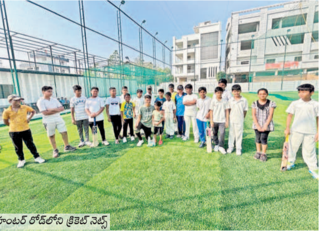
హనుమకొండలో క్రికెట్ నెట్స్

మారుతున్న ట్రెండ్లకు అనుగుణంగా క్రికెట్ నెట్స్ పుట్టుకొస్తున్నాయి. ప్రస్తుతం నగరంలో దినో కాపడంతో క్రికెట్ మైదానాలు చాలా బిజీగా కనిపిస్తున్నాయి. దీంతో నగరంలో సూత కనిపిస్తున్నావు నెట్ క్రికెట్ మైదానాల మైపు క్రికెట్లు క్రేజ్ పెంచుకుంటున్నారు. ప్రస్తుతం ఐపీఎల్ సీజన్ నడుస్తుండడంతో క్రికెట్ కోర్స్ బాగా పెరిగింది. చిన్నపిల్లల నుంచి వయస్సుతో సంబంధం లేకుండా ప్రతిఒక్కరూ క్రికెట్ ఆడేందుకు ఆసక్తి చూపిస్తున్నారు. మైదానాలు లేకపోవడంతో నెట్ క్రికెట్ గ్రౌండ్స్కు