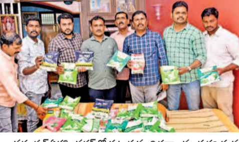
వరంగల్ ఏకశిలవగర్లో పట్టుకున్న విత్తనాలను ప్రదర్శిస్తున్న వ్యవసాయ శాఖ, టాన్స్ ఫోర్స్ అధికారులు