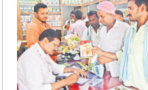
వరంగల్ స్టేషన్ రోడ్డులోని విత్తన షాపులో రైతులు