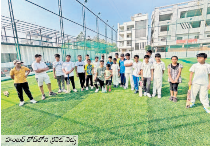
హనుమకొండలో క్రికెట్ నెట్స్

మారుతున్న ట్రెండ్ కు అనుగుణంగా క్రికెట్ నెట్స్ పుట్టుకొస్తున్నాయి. ప్రస్తుతం నగరంలో క్రికెట్ నెట్స్ సందడి నెలకొంది. సమర్థ హాబీ డిన్ కాపడంతో క్రికెట్ మైదానాలు చాలా బిజీగా కనిపిస్తున్నాయి. దీంతో నగరంలో సూత కనిపిస్తున్నా నెట్ క్రికెట్ మైదానాల మైపు క్రికెట్ క్రేజ్ ఏర్పడుతుంటున్నారు. ప్రస్తుతం ఐపీఎల్ సీజన్ నడుస్తుండడంతో క్రికెట్ కోర్స్ బాగా పెరిగింది. చిన్నపిల్లల నుంచి వయస్సుతో సంబంధం లేకుండా ప్రతి ఒక్కరూ క్రికెట్ ఆడేందుకు ఆసక్తి చూపిస్తున్నారు. మైదానాలు క్రికెట్ లేకపోవడంతో నెట్ క్రికెట్ గ్రౌండ్స్ కు