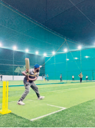
నెట్స్ లో క్రికెట్ ఆడుతూ..

ఎక్కడమంది ఇష్టపడే ఆటలో క్రికెట్ ఒకటి. ముఖ్యంగా ఐపీఎల్ సీజన్ నడుస్తున్న వేళ ప్రతి ఒక్కరికీ ఆడాలనే ఆసక్తి ఉంటుంది. అయితే ఆడాలనే ఉత్సాహం ఉన్నా తీరిక లేక కొందరు.. వీలుదొరికినా ఆటస్థలం ఖాళీగా లేక మరలకొందరు బ్యాట్ పట్టుకోలేకపోతున్నారు. అలాంటి వారి కోసం ఇప్పుడు క్రికెట్ నెట్స్ అందుబాటులోకి వచ్చాయి. మారు తున్న బ్రాండ్ కు అనుగుణంగా చూపు దుస్తున్న నెట్ క్రికెట్ గ్రౌండ్స్ ప్రాక్టీస్ చేసేందుకు సౌలభ్యంగా ఉంటున్నాయి. ఇరువైపులా, వెనుక నెట్టింగ్ గోత్రం చేసిన పిల్లలతో ఎండ వేడి ఉన్నా ఇల్లు దిలేకుండా నిశ్చలంగా ఆడే వీలుండడంతో పాటు రాత్రిపగలూ తేడా లేకుండా మ్యాచ్ లు ఆడుకోవచ్చు. అభిమానుల క్రేజ్ ను దృష్టిలో పెట్టుకొని వరంగల్ నగరంలో వది వరకు క్రికెట్ నెట్స్ ఏర్పాటు చేయాలిగా పిల్లలు, యువత వాటి వైపు పరుగులు తీస్తుండడంతో ఎక్కడ చూసినా నందడి కనిపిస్తోంది.