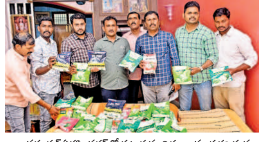
వరంగల్ ఏకశిలనగర్ లో పట్టుకున్న విత్తనాలను ప్రదర్శిస్తున్న వ్యవసాయ శాఖ, టాన్స్ ఫోర్స్ అధికారులు