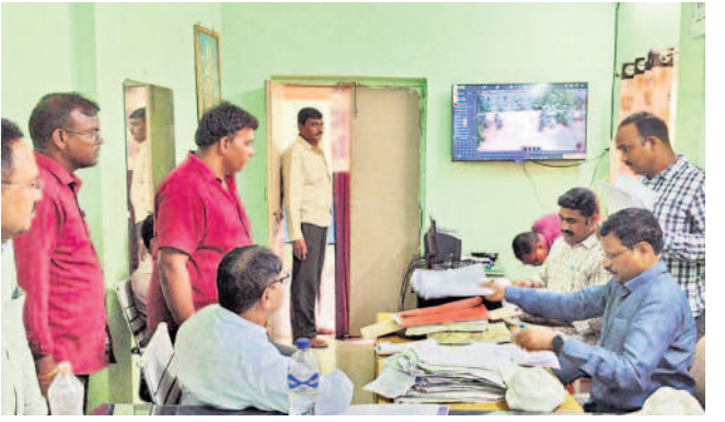
మహబూబాబాద్ ఆర్టీవో కార్యాలయంలో తనిఖీలు చేస్తున్న ఏసీబీ అధికారులు