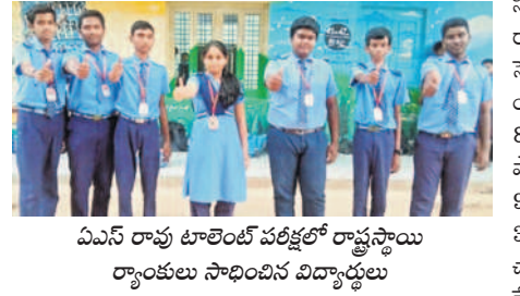
ఏపీసీ రాష్ట్ర టాలెంట్ పరీక్షలో రాష్ట్రస్థాయి ర్యాంకులు సాధించిన విద్యార్థులు

నూర్యాపేట అర్బన్, మే 24 : నూర్యాపేటలోని సిటీ టాలెంట్ హైస్కూల్ ఉత్తమ ఫలితాల సాధిస్తూ జిల్లా కేంద్రంలోనే అగ్రగామి విద్యా సంస్థగా అవతరించింది. పేద, మధ్య తరగతి ప్రజల నుంచి తక్కువ ఫీజులను వసూలు చేస్తూ కార్పొరేట్ స్కూలులో విద్యను అందిస్తూ తల్లిదండ్రుల మన్ననలను పొందుతున్నది. స్వాధీనం చేసిన అనతి కాలంలోనే ఉత్తమ ఫలితాలతో మరో రెండు క్రాంతివేలు ఏర్పాటు చేసి సామాన్యులకు విద్యను అందుబాటులోకి తీసుకొచ్చింది. 100 శాతం ఉత్తీర్ణత.. ఈ విద్యా సంవత్సరం పదే తరగతి పరీక్షలకు పాఠశాల నుంచి 137 మంది విద్యార్థులు హాజరు కాగా 100 శాతం ఉత్తీర్ణత సాధించారు. వారిలో 28 మంది విద్యార్థులు 10 జీపీపీ సాధించారు. 16 మంది