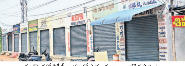
నల్లగొండలో ఏసీబీ దాడులతో షాపులకు తాళాలు వేసిన ఏజెంట్లు

విచారణ చేపట్టారు. విచారణలో ఏజెంట్ల ద్వారా అవకతవకలకు పాల్పడుతున్నట్లు తెలిసిందని డి.పి.సీ తెలిపారు. వాహనాలను తనిఖీ చేసి అధికారి కారుకే నెంబర్ ప్లేట్ లేకపోవడం చర్యనియోగంగా మారినది. కాగా, ఏసీబీ దాడుల విషయం తెలుసుకున్న పలువురు ఏజెంట్లు షాపులకు తాళాలు వేసి పరాచైన కాగా, ఆరుగురు ఏజెంట్లను అదుపులోకి తీసుకున్నారు. ఈ సందర్భంగా డి.పి.సీ మాట్లాడుతూ ప్రభుత్వ కార్యాలయంలో అధికారులు పని చేయకుండా ప్రైవేట్ ఏజెంట్ల ద్వారా చేయమన్నా రన్నారు. ఎం.పి.ఎ, ఆసిస్టెంట్ ఎం.పి.ఎ ఆఫీస్ సిబ్బంది.. ఏజెంట్ల ద్వారా ఆఫీసులో లైసెన్సులు, ఆర్బిఎ ఇతర డాక్యుమెంట్లను స్వాధీనం అవకతవకలకు పాల్పడుతున్నట్లు తెలిసిందన్నారు. ఆరుగురు ఏజెంట్లను