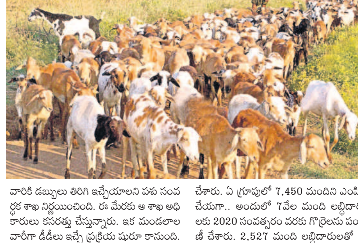
దేశంకొండ నియోజకవర్గంలో 7,311 మంది..

కేసీఆర్ ప్రభుత్వం అమలు చేసిన సంక్షేమ పథకాలని, సందర్భంలో వడ్డాయి. రాష్ట్రంలో కార్యక్రమం చేపట్టి ఐదు నెలలు గడిచినా పథకాల అమలుపై సంతోషం ఉండలేదు. ఇప్పుడు పంపిణీ గాంధీ లోని గత ప్రభుత్వం చేపట్టిన సంక్షేమ పథకాలకు చెక్ పెడుతున్నది. గొర్రెల పథకంపై పాటు కేసీఆర్ కిట్, ముఖ్యమంత్రి సహాయనిధి పెండింగ్ లోనే ఉన్నాయి. ఇతర పథకాలను పెంచి అమలు చేస్తామన్న హామీ కూడా అమలు కాలేదు. పెంపొందించిన రూ. 2,500 కోట్ల భరోసా కింద రైతులకు రూ. 15 వేలు వంటి హామీలు అమలుకు నోచూరేకపోవడంతో సంక్షేమ పథకాలని, సందర్భంలో పడినట్లుంది. - చందంపేట/కొండవల్లిపల్లి, మే 28