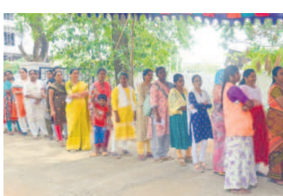
బాబాద్ 72.15 శాతం, బ్రదర్లెక్టోరేట్ గూడెం జిల్లాలో 69.95 శాతం ఓటింగ్ నమోదైంది.