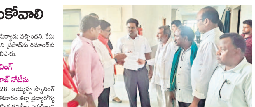
కలెక్టర్ కు వినతిపత్రం అందజేస్తున్న నాయకులు

విన్నాయకనగర్, మే 28: మహిళల ఫోటోలు తీసి బ్లాక్ మెయిల్ పాల్పడు తున్న నిజామాబాద్ నగరంలోని పోచమ్మ గల్లిలో ఉన్న స్కూలింగ్ నింట్ల చర్యలు తీసుకోవాలని డిమాండ్ చేస్తూ మంగళవారం నింట్ల ఎదుట మహిళా సంఘాలు ధర్మా చేశాయి. అనంతరం కలెక్టర్ రాజీవ్ గాంధీ హస్తాంతం, సీబీ కల్చరల్ విన్ లోని ఎన్ హెచ్ వో విజయ్ బాబు మాట్లాడుతూ పోచమ్మ గల్లిలో ఆయన మోసం గా గోస్టిక్ నింట్లలో కంప్యూటర్ టెక్నిషియన్ గా పనిచేస్తున్న నీటి ప్రవాహ మహిళల ఫోటోలు తీసి బ్లాక్ మెయిల్ చేస్తున్నట్లు ఈ