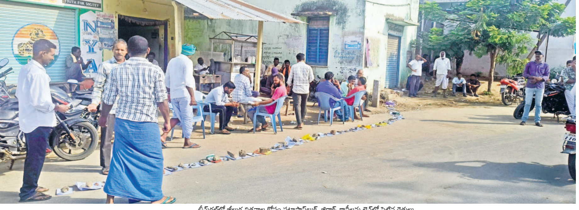
భీమ్ గల్ లో జిల్లా విత్తనాల కోసం పట్టా పానీ, జిరాఫీ కాపీలను లైన్ లో పెట్టిన రైతులు

భీమ్ గల్, మే 28: నిజామాబాద్ జిల్లాలో విత్తనాల కోసం రైతులు పడ రాని పొట్టు పడుతున్నారు. పడేండ్ల కిందటి దృశ్యాలు మళ్ళీ కనిపి స్తున్నాయి. విత్తనాల కోసం పడేండ్ల కిందటి పట్టా పానీ పుస్త కాలు, చెప్పలు క్యూలో పెట్టిన విధంగానే ప్రస్తుత పరిస్థితులు కని విస్తున్నాయని రైతులు ఆందోళన చెందుతున్నారు. భీమ్ గల్ పట్టణంలోని నందిగల్లీ పీఏసీఎస్ గోదాము వద్ద జిల్లా విత్తనాల కోసం మంగళవారం రైతులు పట్టా పానీ పుస్తకాల జిరాఫీ కాపీ లను లైన్ లో పెట్టి ఉదయం నుంచి పడిగావులు కాశారు. ఈ సందర్భంగా పలువురు రైతులు మాట్లాడుతూ టీఎన్ఎస్ హయాంలో విత్తనాలు, ఎరువుల కోసం ఇబ్బందులు పడలేదని, కాంగ్రెస్ ప్రభుత్వం రావడంతో క్యూలో నిలబడే పరిస్థితి వచ్చిందన్నారు. ఇప్పటికైనా ప్రభుత్వం రైతులకు సరిపడా విత్తనాలను సరఫరా చేయాలని డిమాండ్ చేశారు.