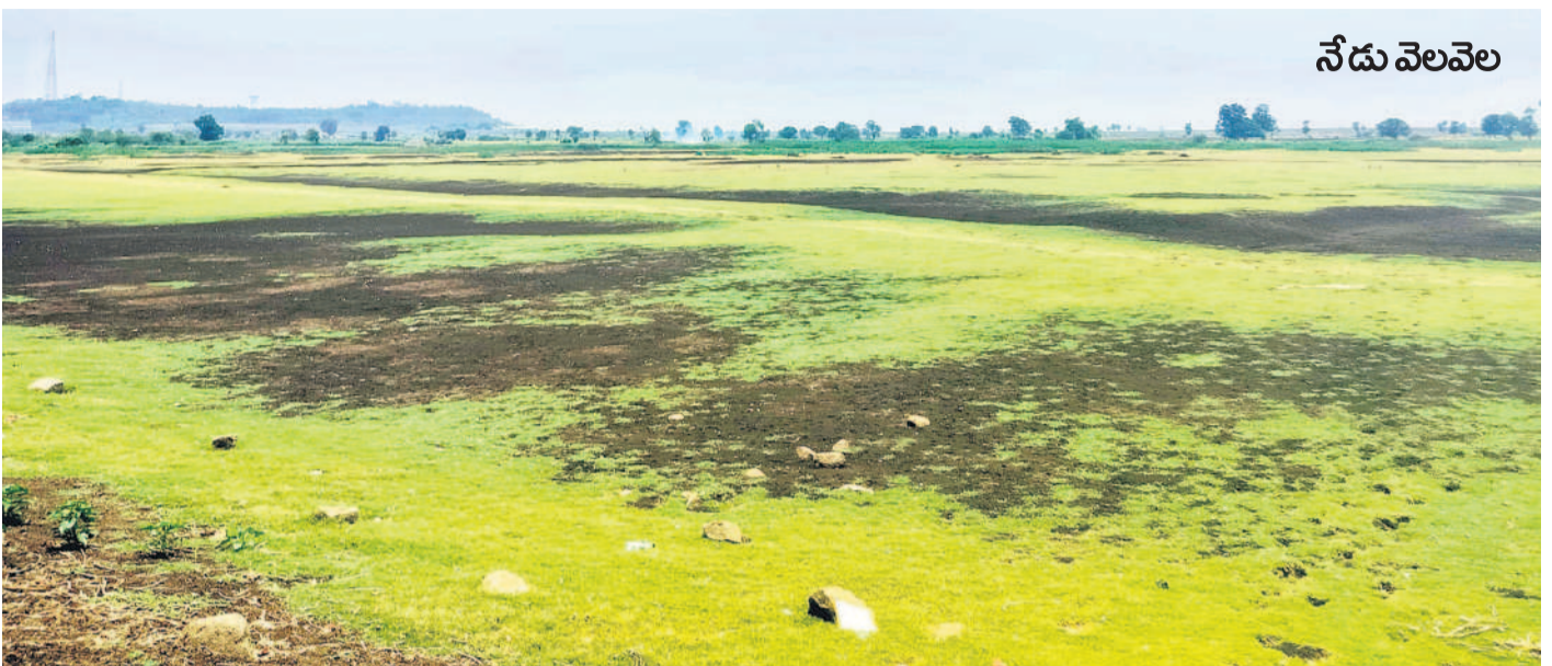
కామారెడ్డి జిల్లా సదాశివనగర్ మండల కేంద్రంలోని చెరువు గతేడాది ఇదే నెలలో జలకళతో నిండుకుండలా ఉన్నది. దీంతో భూగర్భ జలాలు సమృద్ధిగా పెరిగి చుట్టూ ఉన్న బోరుమొట్టర్లు నిండుగా పోసేవి. ప్రస్తుతం ఇదే చెరువు నీళ్లు లేక వెలవెలబోతున్నది. అప్పుడే క్రీడా మైదానంలా కనిపిస్తున్నది. దీంతో రైతులు ఆందోళన చెందుతున్నారు.