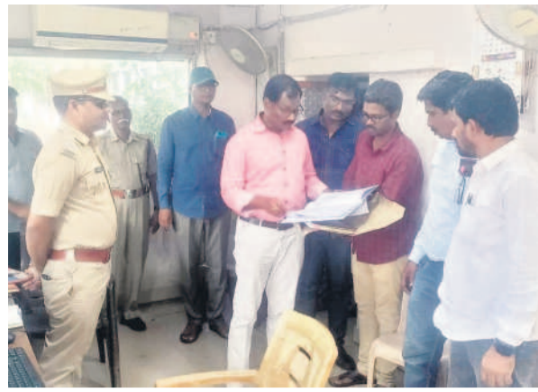
సాలూరా అంతర్జాతీయ చెక్పోస్టులో తనిఖీ చేస్తున్న ఏసీబీ అధికారులు