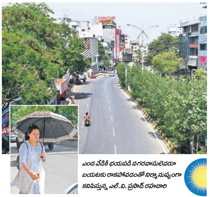
ఎండ వేడికి భయపడి నగరవాసులెవరూ బయటకు రాకపోవడంతో నిర్మాణ వ్యూహం కనిపిస్తున్న ఎల్.వి. ప్రసాద్ రహదారి

ఖాళీ తగుడు గాలులకు చెట్లు కూలడంతో ధ్వంసమైన విద్యుత్ సరఫరా వ్యవస్థ సరూప్యంగా నిర్మిస్తే సరఫరా పనులు గంటల తరబడి పునరుద్ధరణ పనులు సిటీబ్యూరో, మే 28 (సమస్త తెలంగాణ): ప్రకృతి ప్రకోపంతో విద్యుత్ వ్యవస్థ ధ్వంసమైంది. విద్యుత్ సరఫరాను పునరుద్ధరించడమే లక్ష్యంగా పెట్టుకొని విద్యుత్ శాఖ ఆది కార్యక్రమం మొదలుపెట్టింది. కార్యక్రమం మొదలైన నెల నుంచి మొత్తం గ్రూప్ రాత్రి, పగలు అనే తేడా లేకుండా పని చేస్తోంది. ఇదంతా ప్రత్యేకంగా చూస్తున్న ప్రాంతాల్లో గాలివాన దుమారానికి చాలా చోట్ల చెట్లు కూలి విద్యుత్ లైన్లు, ప్రభుత్వాలపై పడిపోయాయి. దీంతో గంటల తరబడి సరఫరా నిలిచిపోయి ఆంధ్రకారం నెలకొంది. సరూప్యంగా నిర్మిస్తే సరఫరా పనులు గంటల తరబడి పునరుద్ధరణ పనులు సిటీబ్యూరో, మే 28 (సమస్త తెలంగాణ): ప్రకృతి ప్రకోపంతో విద్యుత్ వ్యవస్థ ధ్వంసమైంది. విద్యుత్ సరఫరాను పునరుద్ధరించడమే లక్ష్యంగా పెట్టుకొని విద్యుత్ శాఖ ఆది కార్యక్రమం మొదలుపెట్టింది. కార్యక్రమం మొదలైన నెల నుంచి మొత్తం గ్రూప్ రాత్రి, పగలు అనే తేడా లేకుండా పని చేస్తోంది. ఇదంతా ప్రత్యేకంగా చూస్తున్న ప్రాంతాల్లో గాలివాన దుమారానికి చాలా చోట్ల చెట్లు కూలి విద్యుత్ లైన్లు, ప్రభుత్వాలపై పడిపోయాయి. దీంతో గంటల తరబడి సరఫరా నిలిచిపోయి ఆంధ్రకారం నెలకొంది.