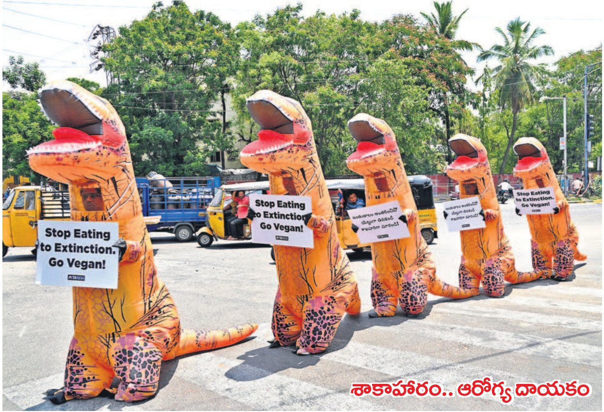
మాంసం ప్రియులకు ముక్కలేనిది ముద్ద దిగదు. లయిచే మాంసాన్ని భుజించే వాళ్ళు రోజూ రోజూకు అధికం అవుతున్నారు. ఈ నేపథ్యంలో జంతుజాలం అంతరించుకోవే వర్షానికి వస్తుందని ఓ స్వచ్ఛంద సంస్థ ముందుగా ఆలోచించి పరిరక్షణ చర్యలు చేపట్టడం అదుగులు వెసింది. కేరళలో పార్క్ లాంటి సిగ్నల్ వద్ద శాకాహారిని మద్దతుగా ముగ్గుల వారం ప్రదానం చేపట్టింది.

సిటీబ్యూరో, మే 28 (సమస్త తెలంగాణ): గ్రేటర్లో ప్రమాదకరంగా మారిన శిథిల భవనాలపై జీహెచ్ఎంసీ స్పెషల్ డ్రైవ్ కొనసాగుతున్నది. వర్షాకాలం నేపథ్యంలో ముందస్తు జాగ్రత్తగా జీహెచ్ఎంసీ టౌన్ ప్లానింగ్ విభాగం అధికారులు సర్టికే వారిగా ప్రత్యేక బృందాలు క్షేత్రస్థాయిలో చర్యలు చేస్తున్నారు. శేరిలింగంపల్లి, కూకట్‌పల్లి, ఖైరతాబాద్, సికింద్రాబాద్, ఎల్వీనగర్, చార్మినార్ జోన్ల పరిధిలో 487 శిథిల భవనాలు ఉన్నట్లు అధికారులు గుర్తించారు. సంబంధిత యాజమానులకు నోటీసులు జారీ చేశారు. స్పందించిన యజమానులు ఖాళీ చేయడం, కూల్చడం, మరమ్మతులు చేపట్టడం లాంటి చర్యలు చేపట్టారు. 117 చోట్ల చర్యలు తీసుకోగా, పెండింగ్ లో ఉన్న 370 పురాతన కట్టడాలపై చర్యలు తీసుకోవాల్సి ఉంది. అత్యధికంగా చార్మినార్ లో 107, సికింద్రాబాద్ లో 103, ఖైరతాబాద్ లో 89 పెండింగ్ జాబితాలో ఉన్నాయి. పురాతన కట్టడాల కూల్చివేతల డ్రైవ్ కొనసాగుతుంది, వచ్చే పది రోజుల్లో డ్రైవ్ పూర్తి చేయనున్నట్లు అధికారులు వెల్లడించారు. ఒక్క ప్రాంతం జరగకుండా అన్ని చర్యలు చేపడుతున్నట్లు అధికారులు పేర్కొన్నారు.