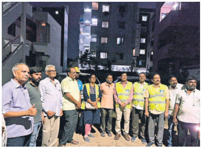
రాల్ఫ్ వేగ్ లో విద్యుత్ సరఫరా పునరుద్ధరణ పనులు చేస్తున్న విద్యుత్ శాఖ ఉద్యోగులతో కాలనీవాసులు

మేడ్చల్, మే 28 (సమస్త తెలంగాణ): మత్స్య కార్మికుల సంక్షేమానికి గాను.. చెరువుల్లో చేప పిల్లల వదిలివేతకు ప్రభుత్వం ఇప్పటి వరకు టెండర్లను ఖరారు చేయలేదని మత్స్య సహకార సంఘాల సభ్యులు ఆందోళన చెందుతున్నారు. వానాకాలం ప్రారంభం కాకముందు చెరువుల్లో చేప పిల్లల వదిలివేతకు ప్రభుత్వం టెండర్ల ప్రక్రియను పూర్తి చేయాలి ఉంటుంది. అయితే టెండర్ల ఖరారుపై ఇప్పటి వరకు మేడ్చల్-మల్కాజ్ గిరి జిల్లా మత్స్యశాఖకు ఎలాంటి సమాచారం లేదు. దీంతో మత్స్య సహకార సంఘాల సభ్యులు ఆవేదన చెందుతున్నారు. మత్స్య కారుల సంక్షేమానికి ప్రతి ఏడాది జిల్లాలోని 233 చెరువుల్లో వంద శాతం సబ్సిడీపై 63 లక్షల చేపపిల్లలను వదిలే విధంగా అప్పటి టీఆర్ఎస్ ప్రభుత్వం చర్యలు తీసుకుంది. జిల్లాలో 82 మత్స్య ప్రాధికార సహకార సంఘాల ఉండగా 3,738 మంది సభ్యులు ఉన్నారు. మత్స్యశాఖ ఆదినంలోని చెరువులను నామ మాత్రపు కొలుపై అందించి మత్స్యకార్మికుల సంక్షేమానికి కృషి చేసింది. అయితే ఇప్పటి వరకు చెరువుల్లో చేపపిల్లలను వదిలే టెండర్ల ఖరారు కాకపోవడంతో మత్స్యసహకార సంఘాల సభ్యులు ఆందోళన చెందుతున్నారు. ఆసలు ఈ యేడు చెరువుల్లో చేపపిల్లలను వదులుతారా? లేదా అన్న అనుమానాలను వ్యక్తం చేస్తున్నారు.