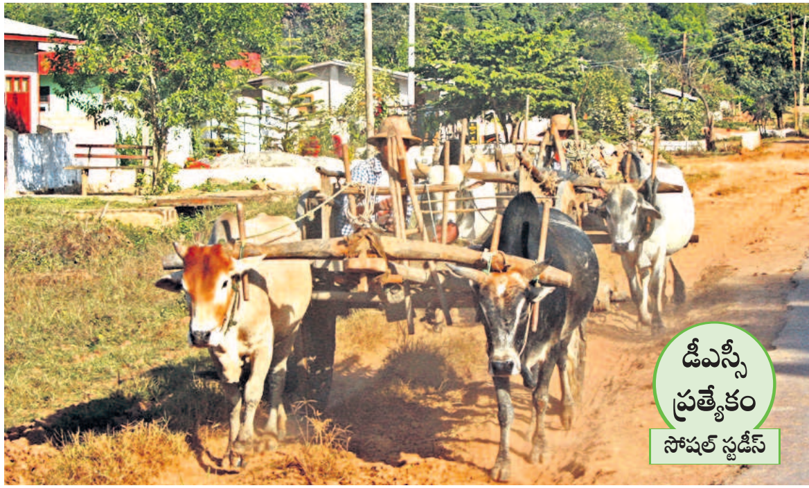
డిఎస్సీ ప్రత్యేకం సోషల్ స్టడీస్

రాంపురం పశ్చిమ ఉత్తరప్రదేశ్ లోని సారవంతమైన గంగా మైదానపు ఒండ్రునీలలో ఉంది. ఆ గ్రామంలోని వ్యవసాయం, అల్లిక వ్యవస్థ, జనాభా, సహజ వనరులు, నీటి పారుదల వంటి తదితర వివరాలను తెలుసుకుందాం.