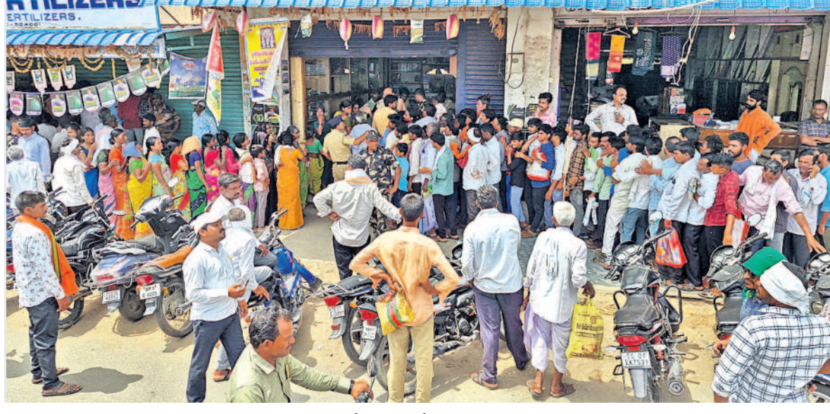
మంగళవారం ఆదిలాబాద్ జిల్లా కేంద్రంలో విత్తనాల కోసం ఉదయం నుంచి బారులు తీరిన రైతులు, మహిళలు

ఆదిలాబాద్, మే 28 (నవస్త్రే తెలంగాణ) : నవస్త్రే తెలంగాణ నెట్ వర్క్, మే 28 : దుక్కులు సిద్దం చేసి, విత్తనాల కోసం పోతే రైతులకు నరకయాతన తప్పదం లేదు. ఆదిలాబాద్ లో మంగళవారం పత్తి విత్తనాల కోసం ఎండను తిప్పేయకుండా గంటల తరబడి బారులు తీరిన రైతులపై పోలీసులు చిండులు తొక్కారు. ఒకానొక దశలో తొప్పులాబ జరగడంతో లాఠీలతో చెదరగొట్టారు. అలాగే అణగారిన వారిపై కేసులు పెట్టాలి, చర్యలు తీసుకోవాలి, అని డిమాండ్ చేశారు.