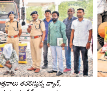
వరంగల్ ఫోర్స్ రోడ్ లో పట్టుకున్న పత్తి విత్తనాల ప్యాకెట్లు