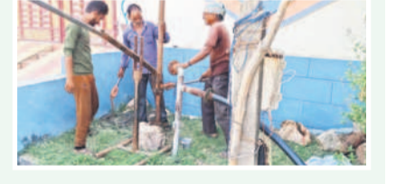
నీటి సమస్యను పరిష్కరించారు.

నాగిరెడ్డిపేట, మే 28: మండల కేంద్రం లోని సాయి నగర్ కాలనీలో బోరుమొట్టారుకు మరమ్మతులు జరుగుతున్నాయి. బోరుమొట్టారుకు మరమ్మతులు జరుగుతున్నాయి. బోరుమొట్టారుకు మరమ్మతులు జరుగుతున్నాయి. బోరుమొట్టారుకు మరమ్మతులు జరుగుతున్నాయి.