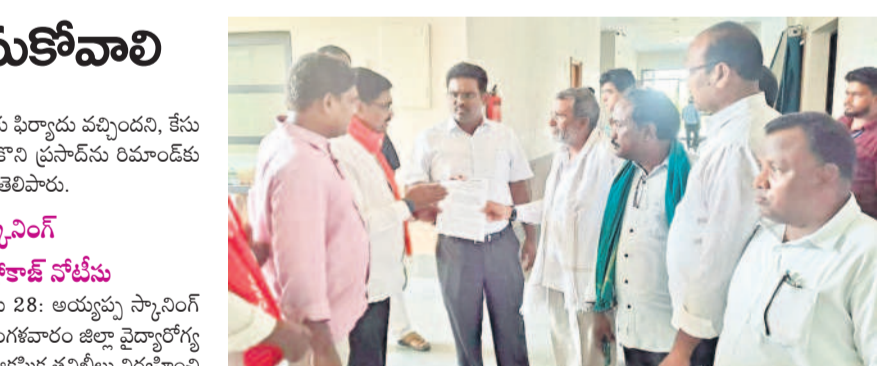
కలెక్టర్ కు వినిపించడం అందజేస్తున్న నాయకులు