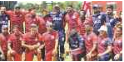
నమస్తే తెలంగాణ క్రిడా విభాగం

భారత్లో క్రికెట్ అంటే ఓ మతం. రవి అస్సమించని సాహసాన్ని నెలకొల్పిన బ్రీటిష్ వీరిని కామన్వెల్త్ దేశాల్లోని క్రికెట్ అడే దేశాల్లో ఈ ఆటకు మంచి ఆదరణ ఉంది. ఇక్కడ ప బోర్న్లు జరిగినా ఫుల్ క్రీకే ఉంటుంది. కానీ మరో నాలుగు రోజుల్లో మొదలుకాబోయే ఐసీసీ టీ20 వరల్డ్ కప్-2024కు ఓ ప్రత్యేకత ఉంది. క్రికెట్ అంటే అమెరికాభిమానం ఉన్న వెస్టిండీస్ పాటు ఈ ఆటతో సంబంధమే లేని అమెరికా సంయుక్త రాష్ట్రాల (యూఎస్ఎ) వేదికగా 9వ పోటీ ప్రపంచకప్ పోరు జరుగనుంది. బేస్ బాల్, బాస్కెట్ బాల్ అంటే చచ్చే అమెరికన్లు... క్రికెట్ను ఏ మేరకు ఆదరించగలరు?