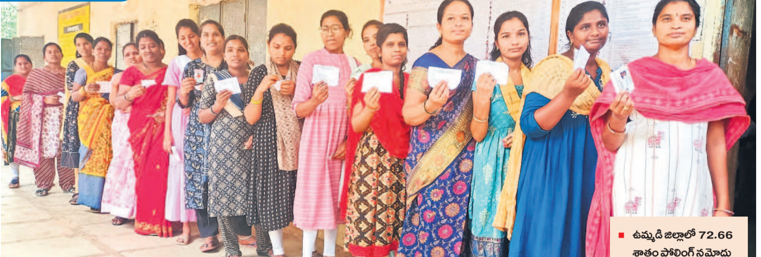
నర్మల పోలింగ్ కేంద్రంలో ఓటు వేసేందుకు క్యూలో వున్న పట్టభద్రులు