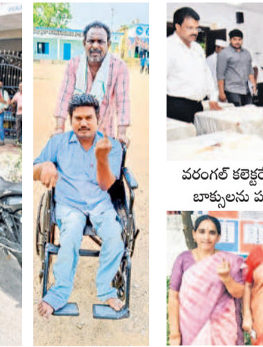
జనగామలో చంటి పాపతో ఓటేసిన పట్టభద్రులూ, వరంగల్లో ఓటు వేసిన దివ్యాంగురాలైన తన అక్కను తీసుకెళ్తున్న సోదరుడు, ఓటేసినట్లు చూపుతున్న దివ్యాంగుడు