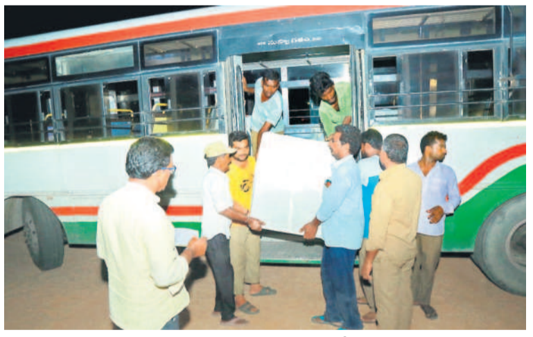
బ్యాకప్ బాక్సులను నల్లగొండ స్టాండ్ రూమ్స్ కు తీసుకొచ్చిన నిబంధన

వధూల వారిగా పలుమార్లు సమావేశాల్లో పాల్గొని దిశానిర్దేశం చేయడంతో పార్టీ నేతలు, శ్రేణులు క్షేత్ర స్థాయి వరకు ఉత్సాహంగా పనిచేశారు. పోలింగ్ రోజు సోమవారం కూడా దాదాపు ఉమ్మడి జిల్లా పరిధిలోని ప్రధాన పట్టణాల్లో పర్యటిస్తూ పోలింగ్ కేంద్రాల వద్ద పార్టీ శ్రేణులతో మమేకమయ్యారు. దాంతో పోలింగ్ కు ముందే కాంగ్రెస్ పార్టీ కాటెజీ సినిట్లు విస్తృత ప్రచారం సాగడంతో బీఆర్ఎస్ కు మరలించిన అధికార ఉదధన, మరోసారి గులాబీ తోడ్పడిన చర్చ కొనసాగింది. ఇవన్నీ ఎలా ఉన్నా ఫైనల్ గా వచ్చే నెల 5 నుంచి కొనసాగి ఉట్ట చేశారు. వీటన్నింటి రీత్యా చివర వరకు బీఆర్ఎస్ శ్రేణుల శ్రమను ప్రతిబింబిస్తూ పోలింగ్ సరళిలో