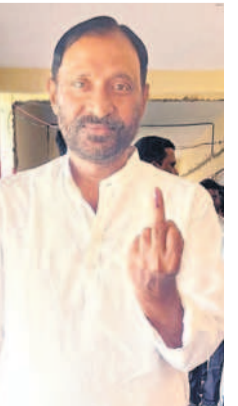
తిరుమలగిరి(సాగర్)లో ఎమ్మెల్యే కోటిరెడ్డి