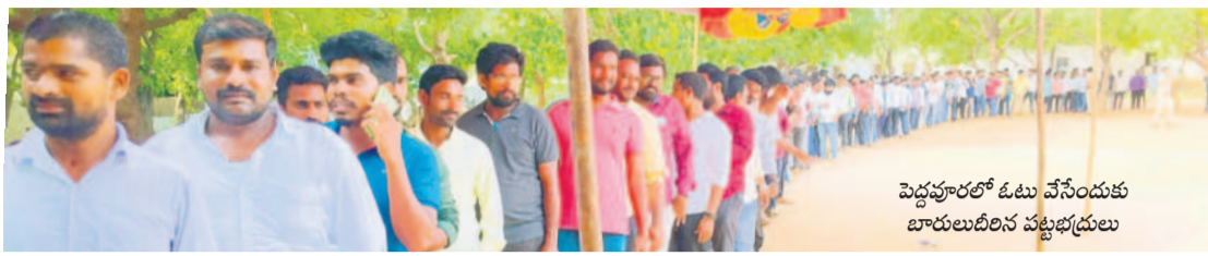
పెద్దపూర్లో ఓటు వేసేందుకు బారులుదీరిన పట్టభద్రులు

ప్రశాంతంగా నల్లగొండ-ఖమ్మం-వరంగల్ గ్యాడ్యూయేట్ ఎమ్మెల్యే ఉప ఎన్నిక