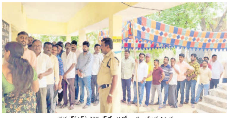
అత్యుపాధ్యక్షులు (ఎస్) పోలింగ్ కేంద్రంలో బారులుదీరిన ఓటర్లు