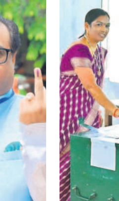
సూర్యాపేటలో కలెక్టర్ వెంకట్రావు