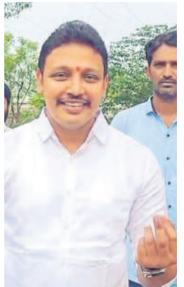
హోయిలో ఓటు వేసిన మాజీ ఎమ్మెల్యే నోముల భగవత్