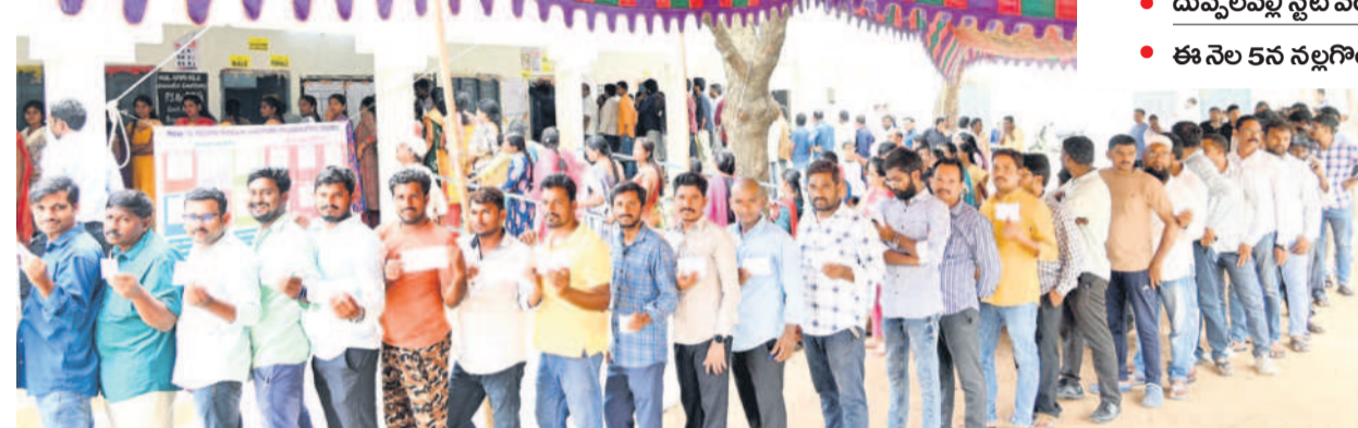
నల్లగొండ బోయవాడ పోలింగ్ కేంద్రంలో ఓటు వేసేందుకు బారులుదీరిన పట్టభద్రులు

ఓట్ల వేసే సమయం చేసే సమయం కాని.. ఉప ఎన్నిక కావడంతో పట్టభద్రులు ఓటింగ్ అసక్తి పూర్తిగా తారా లేదా అన్న సందేహానికి తరలింపకుండా భారీగా తరలివచ్చారు. సాధారణ ఎన్నికలను తలపెట్టిన పట్టభద్రుల ఓటింగ్ లో పాల్గొన్నారు. సామాజిక అంశాల వరంగల్-ఖమ్మం-నల్లగొండ శాసనసభ పట్టభద్రుల నియోజకవర్గ ఉప ఎన్నిక కల్లో భాగంగా పోలింగ్ నమోదైంది. ఉదయం 10 గంటలకు మండకొడిగా మొదలైన పోలింగ్ కొన్ని చోట్ల రాత్రి 6 గంటల వరకు కొనసాగింది. పట్టణ ప్రాంతాల్లో ఎక్కువ పోలింగ్ బాక్సులు సాయంత్రం వరకు ఓటర్లతో నిండి ఉన్నాయి. సాయంత్రం 4 గంటల వరకు 68.65 శాతం పోలింగ్ నమోదైంది. తుది పోలింగ్ శాతం మంగళవారం వెల్లడించనున్నట్లు అధికారులు తెలిపారు. కాగా 2021 ఎన్నికల్లో అత్యధికంగా ఎన్నడైన విభాగా అత్యధికంగా 76.41 శాతం ఓట్లు పోలింగ్ కేంద్రాల్లో ఎక్కువ చోట్ల బేరజాలోని ఓట్ల నిష్పాతం వెల్లడైంది. గ్రామీణ, పట్టణ అనే తేడా లేకుండా అన్ని చోట్లా మంచి స్పందన కనిపించింది. ఇదే సమయంలో కాంగ్రెస్ నేతలు ముందే కాడి పారేసిన చందంగా వ్యవహరించడం చర్చియించుతుంది.