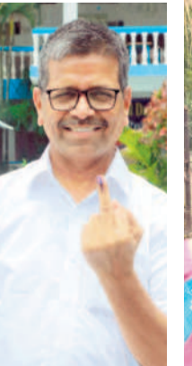
నల్లగొండలో ఎమ్మెల్యే నర్సారెడ్డి