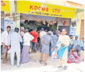
గొల్లపల్లి డీసీఎంఎస్ కేంద్రం వద్ద జీలుగ విత్తనాల కోసం నిరీక్షిస్తున్న రైతులు

గొల్లపల్లి మండల కేంద్రంలోని డీసీఎం ఎస్, ఏఆర్ఎన్ కే కేంద్రాల ద్వారా సబ్సిడీపై జీలుగ విత్తనాలను ప్రభుత్వం సరఫరా చేయగా, ఒక్కో కేంద్రానికి 834 (ఒక్కోచోట్ల 30 కిలోలు) బస్తాలు మాత్రమే కేటాయింపడంతో వాటి కోసం రైతులు ఎగబడ్డారు. మండలంలో 27 గ్రామాలందాగా పదివేల పైచిలుకు రైతులున్నారు. పట్టణ పానీబుక్ ఒక్క బస్తానే ఇవ్వడంతో అవి సరిపోవని నిర్యాహకుడితో రైతులు అవినీతి దిగారు. ఐదెకరాలకు పైత ఉన్న వారికి ఒక్క బస్తా ఏమూలకు సరిపోతుందని మండిపడ్డారు. ఒక్క బస్తా కోసం ఒక్క రోజుకా కేంద్రాల వద్ద పడికాపులు కాయాలి వచ్చిందన్నారు. డీసీఎంఎస్ నిర్యాహకుడు రైతుల పానీబుక్ జిరాక్స్ తీసుకుని పేపర్ పిలుస్తూ రైతుల ఒక బస్తా డొప్పన అందించారు. మొదటి విడతగా వచ్చిన పచ్చిరొట్ట విత్తనాలు 20 శాతం మంది రైతులకు కూడా సరిపోకపోవడంతో మిగిలిన వారు నిరాశగా వెనుదిరిగారు.