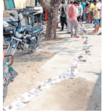
మల్యాలలో పచ్చిరొట్ట విత్తనాల కోసం క్యూలో పెట్టిన పానీబుక్ జిరాక్స్ ప్రతులు

ఉమ్మడి రాష్ట్రంలో అనుభవించిన కష్టాలు మళ్ళీ కనిపిస్తున్నాయి. క్యూలైన్లలో పానీబుక్ తింటూ పత్రాల పెట్టె నిరీక్షించాల్సిన పరిస్థితులు వచ్చాయి. పచ్చిరొట్ట విత్తనాల కోసం రైతులు మళ్ళీ అవ్వలు పడుతున్నారు. ఒక్క పట్టణంలో పానీబుక్ ఒక్కటి, కొన్ని చోట్ల రెండు బస్తాలు మాత్రమే ఇవ్వడం దేశో అవి ఏ మూలకు సరిపోతాయని ఆగ్రహం వ్యక్తం చేస్తున్నారు. - మల్యాల/ గొల్లపల్లి, మే 27