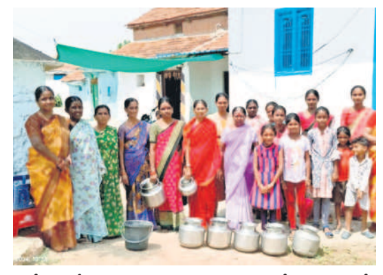
కోసరావుపేట మండలం నిజామాబాద్ గ్రామంలోని 8వ వార్డులో ఖాళీ బిందెలతో ఆందోళన చేస్తున్న మహిళలు

కోసరావుపేట, మే 27 : తాగునీటి కోసం మహిళలు రోడ్లెక్కిన. కోసరావుపేట మండలం నిజామాబాద్ గ్రామంలోని 8వ వార్డులో మహిళలు ఖాళీ బిందెలతో సోమవారం గ్రామంలో ఆందోళన చేశారు. వారం రోజుల నుంచి నల్ల నీరు రాకపోవడంతో తీవ్ర ఇబ్బందులు పడుతున్న మని ఆవేదన వ్యక్తం చేశారు. గ్రామ పంచాయతీ సెక్రటరీ దృష్టికి తీసుకు వెళ్లి ఒక్క రోజు మాత్రమే వాటర్ ట్యాంకు ద్వారా సరఫరా చేస్తామని తెలిపారు. ఈ విషయంపై కార్యదర్శి సంప్రదించగా, సాయంత్రం వేళే వాటర్ ట్యాంకుతో తాగునీటిని అందించినట్లు పేర్కొన్నారు.