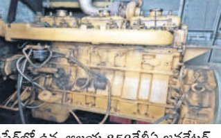
లవేరలో ఉన్న అలయం 250కేపీఎ జనరేటర్

వేసవివాడ, మే 27 : వేసవి సెలవుల సందర్భంగా రాజన్న అలయానికి భక్తులు తాకిడి పెరిగింది. ప్రతిరోజూ వేలాది మంది తరలిరావడం కనిపిస్తున్నది. ఎండకాంం కావడంతో భక్తులు ఏసీ పవర్ గడుల్లో ప్రాధాన్యతనిస్తూ టీమేజర్ల సడన్ గడుల్లో విడిచి వేస్తున్నారు. అయితే జనరేటర్ పనిచేయక విద్యుత్ కట్ చేసినప్పుడల్లా ఇబ్బంది పడుతున్నారు. రాజన్న అలయానికి మూడు జనరేటర్లు ఉన్నాయి. అందులో ఒకటి 250 కేపీఎ, మరో రెండు 125కేపీఎ జనరేటర్లు ఉన్నాయి. విద్యుత్ అంతరాయం ఏర్పడినప్పుడు 250 కేపీఎ, 125కేపీఎ ప్రధానాలయం, అనుబంధ అలయాలు, పరిపాలన కార్యాలయం, టీమేజర్ల సడన్ (ఏసీ), పార్కర్లు ఉన్న పవర్ గడులు, పంపు మోటార్లకు విద్యుత్ సరఫరా అవుతుంది. సందేశ్యర్, అక్కి గణపతి పవర్ గడులు సమూహాలతో