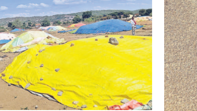
రుద్రంగిలో నెల రోజులుగా పేరుకుపోయిన ధాన్యం కుప్పలు

రుద్రంగి, మే 27 : రైతాంగం ఆరిగోస పడుతున్నది. ధాన్యం కొనుగోళ్లలో సర్కారు నిర్లక్ష్యంతో కన్నీరు పెడుతున్నది. మొన్నటిదాకా సాగునీరు లేక, కరెంట్ సరిగ్గా ఉండక ఆరిగోస పడి, పండించిన కొద్దిపాటి ధాన్యాన్ని కేంద్రాలకు తరలిస్తే.. సకాలంలో కొనేవారు లేక ఆగమవుతున్నది. సెంట్రల్లకు వడ్లు తెచ్చి పదిపాను అయ్యే రోజులైనా కొనకపోవడం, రోజురోజుకూ రాతులు మేరుకుపోవడం, మరోవైపు గన్నీ సంచలు, లాటిల కొరతతో కొన్నది వెనువెంటనే మిల్లులకు తరలించకపోవడంతో అటు ధాన్యాన్ని, ఇటు బస్తాలను కాపుకాయలేక, అకాల మండలమే కాపుకొలేక ఆందోళన చెందుతున్నది. అక్కడ క్రూడ కండ్ల ముండి తడిసిపోయి మొలకెత్తుతుండడంతో ఆవేదన చెందుతున్నది. ఇందుకు రుద్రంగి మండలమే నిదర్శనంగా నిలుస్తున్నది. మండలంలోని