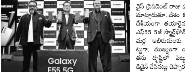
Galaxy F55 5G

న్యూఢిల్లీ, మే 27: సరికొత్త స్మార్ట్ ఫోన్లను దేశీయ మార్కెట్లోకి విడుదల చేసిన సామ్సంగ్ సంస్థ. గెలాక్సీ సీరీస్ లో భాగంగా విడుదల చేసిన ఎస్55 5జి వ్యాన్స్ లెటర్ డిజైన్, 6.7 ఇంచు ఫుల్ హెచ్డీ+ సూపర్ అమోలెడ్ డిస్ప్లే, శక్తివంతమైన స్టామిడ్రాగన్ ప్రాసెసర్ తో ఈ మొబైల్ ను తీర్చిదిద్దంది. 8జీబీ+128జీబీ మెమరీ కలిగిన మాడల్ ధర రూ.26,999 కాగా, 8జీబీ+256 జీబీ మాడల్ రూ.29,999, అలాగే 12జీబీ+256 జీబీ మాడల్ రూ.32,999గా నిర్ణయించింది. హెచ్డీఎస్ డిస్ప్లే, యాక్సిస్ బ్యాంక్, ఐసీ