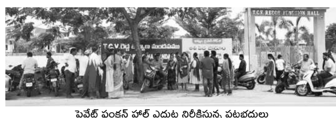
వైవేట్ ఫంక్షన్ హాల్ ఎదుట నిలిచివున్న పట్టణభ్రమలు