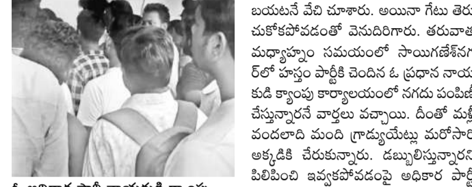
ఓ అధికార పార్టీ నాయకుడి క్యాంపు కార్యాలయంలో పట్టణభ్రమ పడిగాపులు

భద్రులందరూ చాలాసేపటి వరకూ గేటు బయటనే వేచి చూశారు. అయినా గేటు తెరుచుకోకపోవడంతో వెనుదిరిగారు. తరువాత మధ్యాహ్నం సమయంలో సాయిగణేశ్ నగర్ లో హస్తం పార్టీకి చెందిన ఓ ప్రధాన నాయకుడి క్యాంపు కార్యాలయంలో నగదు పంపిణీ చేస్తున్నారనే వార్తలు వచ్చాయి. దీంతో మళ్లీ వందలాది మంది గ్రామ్యయేట్ల మరోసారి అక్కడికి చేరుకున్నారు. డబ్బులిస్తున్నారని పిలిపించి ఇవ్వకపోవడంపై అధికార పార్టీ నాయకులను నిలదీశారు. దీంతో స్పందించిన హస్తం నేతలు.. ఓటర్ల పేర్లు నమోదు చేసుకుంటున్నారని, ఓటు వేసే వచ్చాక డబ్బులు ఇస్తామని చెప్పారు. దీంతో పట్టణభ్రమ మళ్లీ నిరాశ చెందారు. మరోవైపు పోలింగ్ ముగిసే సమయం దగ్గర పడుతుండడంతో చేసేదేమీ లేక పేర్లు నమోదు చేయించుకొని బతుకు జీవుడూ అంబూ పోలింగ్ బూత్ ల బాట పడ్డారు. కాగా.. ఖరీదైన కాళ్ళు, బైకులు వేసుకొని వచ్చిన పట్టణభ్రమలు.. విద్యావంతులు అయి ఉండి కూడా తాయిలాల కోసం ఆరాట పడుతున్నారంటూ అక్కడి సాధారణ ప్రజలు మువ్వటిండుకున్న సంభాషణలు విని పించాయి.