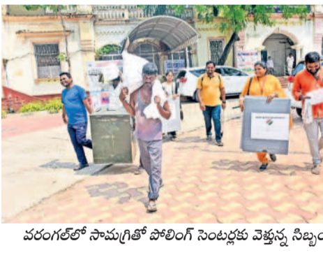
వరంగల్ లో సామగ్రితో పోలింగ్ సెంటర్లకు వెళ్తున్న సిబ్బంది