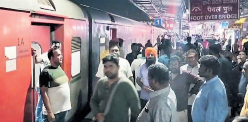
వరంగల్ రైల్వే స్టేషన్ లో ఏపీ ఎక్స్ ప్రెస్ రైలు నుంచి ప్లాట్ ఫాంపైకి వచ్చిన ప్రయాణికులు

గ్రాడ్యూయేట్లకు ఉప ఎన్నిక ప్రచార సరళి గతంలో ఎప్పుడూ లేనంత ఉత్సాహం కనిపించింది. అసెంబ్లీ, ఆ తర్వాత లోక్ సభ ఎన్నికలు ముగిసిన వెంటనే ఈ ఎన్నిక జరుగుతుండడం.. ప్రధాన రాజకీయ పార్టీలకు ప్రతిష్టాత్మకంగా మారింది. ఎమ్మెల్యే నియోజకవర్గ పరిధిలో 12 జిల్లాలు, 34 అసెంబ్లీ నియోజకవర్గాలు ఉన్నాయి. 2023 నవంబర్ 1కి మూడేండ్ల ముందు గ్రాడ్యూయేట్లకు యేపీసీ పూర్తి చేసిన వారికి కేంద్ర ఎన్నికల కమిషన్ ఓటు వేసే అవకాశం కల్పించింది. వరంగల్-ఖమ్మం-నల్లగొండ ఉమ్మడి జిల్లా పట్టణంల నియోజక వర్గంలో 4,61,806 మంది ఓటర్లు ఉన్నారు. వీరిలో 2,87,007 మంది పురుషులు, 1,74,794 మంది మహిళలు, ఐదుగురు ట్రాన్స్ జెండర్లు ఉన్నారు. నియోజకవర్గ పరిధిలో 605 పోలింగ్ కేంద్రాలను ఏర్పాటు చేస్తున్నారు. వరంగల్ ఉమ్మడి జిల్లా పరిధిలో 1,79,413 మంది ఓటర్లు ఉన్నారు. వీరు ఓటు వేసేందుకు వీలుగా 2017 పోలింగ్ కేంద్రాలను ఏర్పాటు చేశారు.