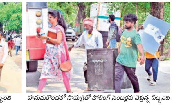
హనుమకొండలో సామగ్రితో పోలింగ్ సెంటర్లకు వెళ్తున్న సిబ్బంది