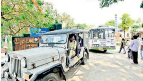
వరంగల్ కలెక్టరేట్ నుంచి పోలింగ్ బంధంబిస్తు మధ్య పోలింగ్ సామగ్రిని తరలిస్తున్న అధికారులు

గ్రాడ్యూయేట్లకు ఉప ఎన్నిక ప్రచార సరళి గతంలో ఎప్పుడూ లేనంత ఉత్సాహం కనిపించింది. అసెంబ్లీ, ఆ తర్వాత లోక్ సభ ఎన్నికలు ముగిసిన వెంటనే ఈ ఎన్నిక జరుగుతుండడం.. ప్రధాన రాజకీయ పార్టీలకు ప్రతిష్టాత్మకంగా మారింది. ఎమ్మెల్యే నియోజకవర్గ పరిధిలో 12 జిల్లాలు, 34 అసెంబ్లీ నియోజకవర్గాలు ఉన్నాయి. 2023 నవంబర్ 1కి మూడేండ్ల ముందు గ్రాడ్యూయేట్లకు యేపీసీ పూర్తి చేసిన వారికి కేంద్ర ఎన్నికల కమిషన్ ఓటు వేసే అవకాశం కల్పించింది. వరంగల్-ఖమ్మం-నల్లగొండ ఉమ్మడి జిల్లా పట్టణంల నియోజక వర్గంలో 4,61,806 మంది ఓటర్లు ఉన్నారు. వీరిలో 2,87,007 మంది పురుషులు, 1,74,794 మంది మహిళలు, ఐదుగురు ట్రాన్స్ జెండర్లు ఉన్నారు. నియోజకవర్గ పరిధిలో 605 పోలింగ్ కేంద్రాలను ఏర్పాటు చేస్తున్నారు. వరంగల్ ఉమ్మడి జిల్లా పరిధిలో 1,79,413 మంది ఓటర్లు ఉన్నారు. వీరు ఓటు వేసేందుకు వీలుగా 2017 పోలింగ్ కేంద్రాలను ఏర్పాటు చేశారు.