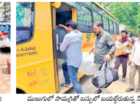
ములుగులో సామగ్రితో బస్సులో బయల్దేరుతున్న సిబ్బంది