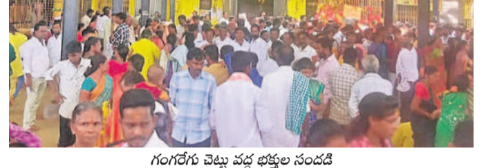
గంగరేగు చెట్టు వద్ద భక్తుల సందడి

చేర్యాల, మే 26: కొమురవెల్లి మల్లికార్జున స్వామి క్షేత్రంలో ఆదివారం భక్తులు సంద చేశారు. సుమారు 20 వేల మందికి పైగా భక్తులు ఆలయానికి వచ్చి స్వామివారిని దర్శించుకుని మొక్కులు తీర్చుకున్నట్లు ఆలయ ఈవో బాలాజీ తెలిపారు. శనివారం నాయంత్రం నుంచే కొమురవెల్లికి చేరుకున్న భక్తులు ఆదివారం స్వామి వారిని దర్శించుకుంటున్నారు. భక్తులు భక్తిశ్రద్ధలతో స్వామి వారి ముఖానికి పూజలు చేస్తున్నారు. కొండ పైన ఉన్న ఎల్లప్పుడు దర్శించుకోవడంతో పాటు మట్టి పాత్రలతో అభ్యంత్రం చేస్తుంటే బోసం తయారు చేసి మొక్కులు చెల్లించుతున్నారు. మరకొండరు రాతిగిరల వద్ద ప్రదక్షిణ, కోడెల స్తంభం వద్ద కోడెల కట్టిపూజలు చేశారు. స్వామివారి దర్శనం కోసం కైలాసికి వచ్చిన భక్తులకు ఏకాదశి గంగా శ్రీనివాస, బుద్ధిశ్రీనివాస, ప్రాణానారాధన మహాదేవుని మల్లికార్జున, ఆలయ సిబ్బంది, అర్చకులు, బృహ్మపూజారులు సేవలందించారు.