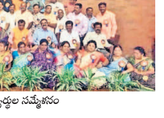
అత్తయ్యల సమ్మేళనం: గోవర్ధనగిరిలో సమావేశమైన పూర్వ విద్యార్థులు, ఉపాధ్యాయులు