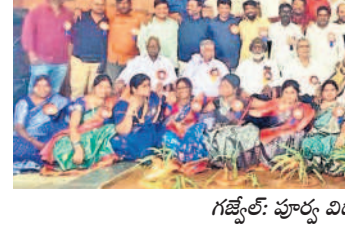
గజ్వేల్: పూర్వ విద్యార్థుల సమ్మేళనం