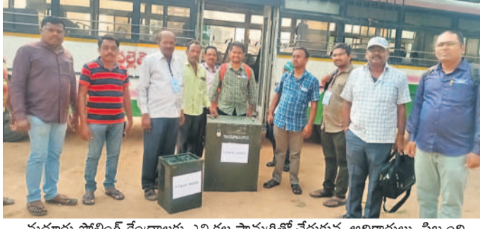
మద్యూరు పోలింగ్ కేంద్రాలకు ఎన్నికల సామగ్రితో చేరుకున్న అధికారులు, సిబ్బంది

మండల ప్రజాపరిషత్ పాఠశాలలో రెండు పోలింగ్ కేంద్రాలు, కొమురవెల్లి, మద్యూరు, ధూళిమిట్టల్ ఒక్కొక్కటి చొప్పున పోలింగ్ కేంద్రాలు ఏర్పాటు చేశారు. చేర్యాలలో 2,555 గ్రామ్యయేట్స్ ఓటర్లలో (1686 మంది పురుషులు, 869 మహిళలు), కొము సాయంత్రం 4వరకు కొనసాగనున్నది. గ్రామ్యయేట్స్ ఓట్ల వేసేందుకు చేర్యాల