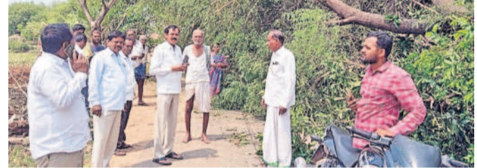
మాటిండ్లలో కూలిపోయిన చెట్టును పరిశీలిస్తున్న బీఆర్ఎస్ నాయకులు, ప్రజాప్రతినిధులు

నారాయణరావుపేట, మే 26: నారాయణరావుపేట, లక్ష్మీదేవిపల్లి, మాటిండ్ల, ఇల్లంపూర్, బంజెరుపల్లి, కొండకాపాపల్లి, గోపులాపురి, జిల్లాపూర్, మల్లాల, గుర్రాలగిరి గ్రామాల్లో శనివారం రాత్రి ఈదురు గాలులతో కూడిన వర్షం పడింది. దీంతో వర్షం ధాటికి విద్యుత్ స్తంభాలు, భారీ వృక్షాలు, ఇండ్లు, పశువుల పాకలు పూర్తిగా దృగ్గోచ్యమయ్యాయి. అధికారులు అధికారులు ఆయా గ్రామాలను సందర్శించి జరిగిన నష్టాన్ని అంచనా వేశారు. అదే విధంగా పలు గ్రామాల్లో బీఆర్ఎస్ నాయకులు సందర్శించి అధికారులు తక్షణమే చర్యలు చేపట్టాలని కోరారు.