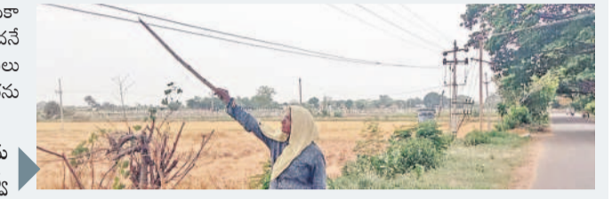
ప్రమాదకరంగా ఉన్న వైర్లను చూపుతున్న మహిళా రైతు ముత్తమ్మ

తప్పుడం లేదు. ఈ విషయాన్ని విద్యుత్ అధికారులకు తెలియజేసినా పట్టించుకోవడం లేదనే ఆరోపణలు ఉన్నాయి. విద్యుత్ అధికారులు స్పందించి కిందికి వేలాడుతున్న విద్యుత్ వైర్లను సరిచేయాలని స్థానికులు కోరుతున్నారు.