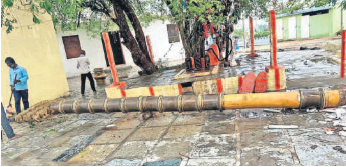
మహబూబ్ నగర్ జిల్లా భూత్పూర్ లోని మునిరంగస్వామి ఆలయంలో కూలిన ద్వజస్తంభం

రాష్ట్రంలో భారీగా ప్రాణ, ఆస్తి నష్టం ఒక్క నాగర్ కర్నూల్ జిల్లాలోనే ఎనిమిది మంది మృతి కూలిన రేకుల పెట్టు, భారీ వృక్షాలు, విద్యుత్తు స్తంభాలు పలుచోట్ల విద్యుత్తు సరఫరాకు అంతరాయం