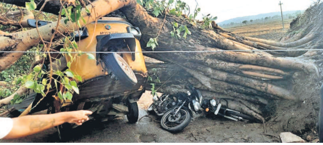
నిజామాబాద్ జిల్లా రుద్రూర్ మండలం అంబం రోడ్డులో అటో, ట్రిసైక్ల వాహనాలపై పడిన భార వృక్షం