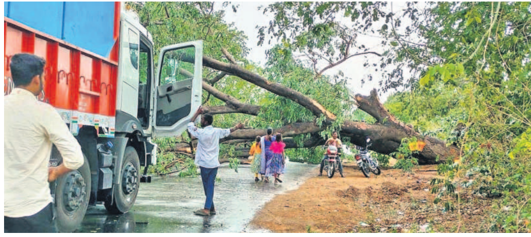
అదిలాబాద్ జిల్లా తాన్ మండలం అన్నాపూర్ రహదారిపై విరిగిపడ్డ భార వృక్షం