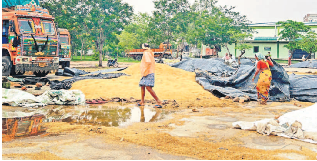
యాదాద్రి భువనగిరి జిల్లా చౌలపల్లెలో వ్యవసాయ మార్కెట్లో తడిసిన ధాన్యం

గుమ్మడిపల్లిలో పిడుగుపాటుకు గడ్డివాము దగ్గర మైంది. ఈదురు గాలులకు మామిడి కాాయలు నేలకూలాయి. చౌబుట్లలో వ్యవసాయ మార్కెట్ తోపాటు పలుచోట్ల ధాన్యం తడిసింది. ఉమ్మడి నిజామాబాద్ జిల్లాలో బాన్సువాడ, కోట్లగిరి, రుద్రూర్, చందూర్, మోస్తా మండలాల్లో గాలి దుమారం తీవ్రనష్టం వాటిల్లింది. బాన్సువాడ మండలం బోర్లం గ్రామంలో 15 గృహ, 10 వ్యవసాయ విద్యుత్తు స్తంభాలు విరిగిపడ్డాయి. సుమారు 20 ఇండ్ల పైకప్పులు ఎగిరిపోయాయి. బాన్సువాడ-కామారెడ్డి ప్రధాన రహదారిపై కొయ్యగట్ల వద్ద భారీ వృక్షం రోడ్డుపై పడింది. బాన్సువాడ మినీ ట్యాంకెంబెడ్ వద్ద సోలార్ హైమాన్ లైట్ స్తంభాలు పడిపోయాయి. రుద్రూర్ మండలం అంబం రోడ్డుపై విరిగి ఇంటి మీద పడింది. అంబం శివారులో