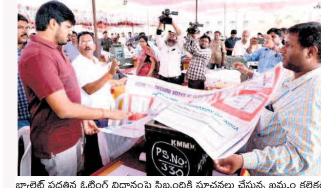
బ్యాలెట్ పత్రాలను ఓటింగ్ విధానంపై సిబ్బందికి సూచనలు చేస్తున్న ఖమ్మం కలెక్టర్

1,23,985 మంది ఓటర్లు.. ఖమ్మం జిల్లాలో మొత్తం 1,23,985 మంది