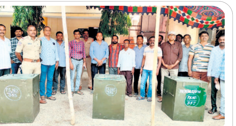
కూసుమంచిలో పోలింగ్ కేంద్రానికి బ్యాలెట్ బాక్కులతో చేరుకున్న ఎన్నికల సిబ్బంది

ఎమ్మెల్యే ఉప ఎన్నిక పోలింగ్ కోసం జిల్లా వ్యాప్తంగా 55 పోలింగ్ కేంద్రాలను ఏర్పాటు చేశారు. జిల్లాలో ఓటు హక్కు సమాచారం చేసుకున్న పట్టభద్రులు మొత్తం 40,106 మంది ఉన్నారు. ఇందులో పురుషులు 22,590, మహిళలు 17,516 మంది ఉన్నారు. అత్యధికంగా చుంపల్లి మండలం బాబుకాంపు 271వ వార్డులో 1145 మంది ఉన్నట్లు గుర్తించారు.