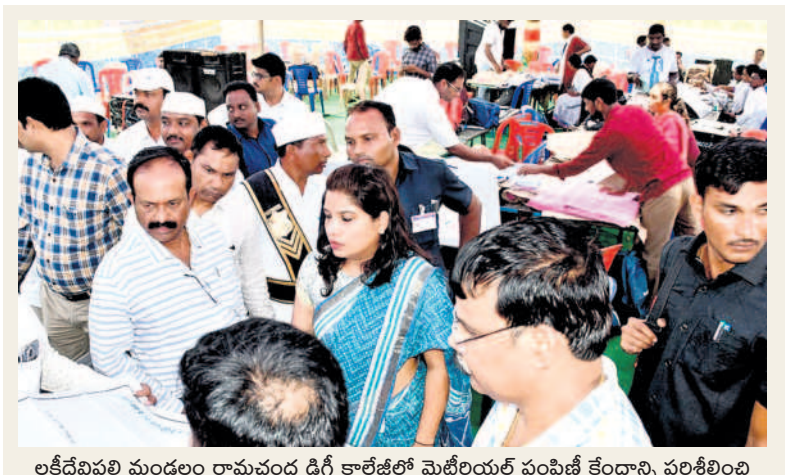
లక్ష్మీదేవిపల్లి మండలం రామచంద్ర దిగ్గి కాలేజీలో మెటీరియల్ పంపిణీ కేంద్రాన్ని పరిశీలించి సిబ్బందికి సూచనలు చేస్తున్న భద్రాద్రి కలెక్టర్ డాక్టర్ ప్రయాంక