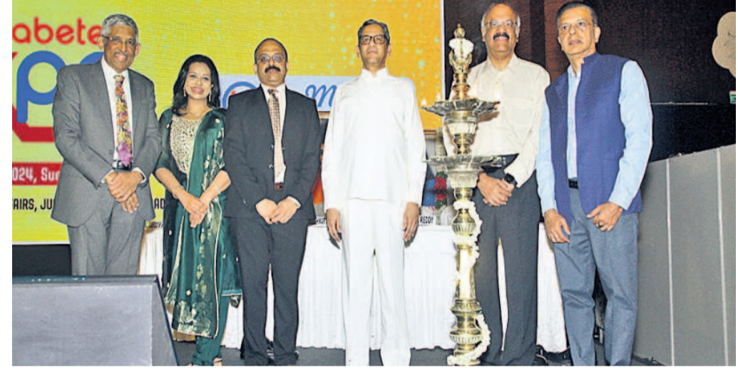
డయాబిటీస్ ఎక్స్ పో - 2024 ప్రారంభోత్సవంలో పాల్గొన్న మాజీ బీపీ జస్టిస్ ఎన్.వి రమణ, తదితరులు