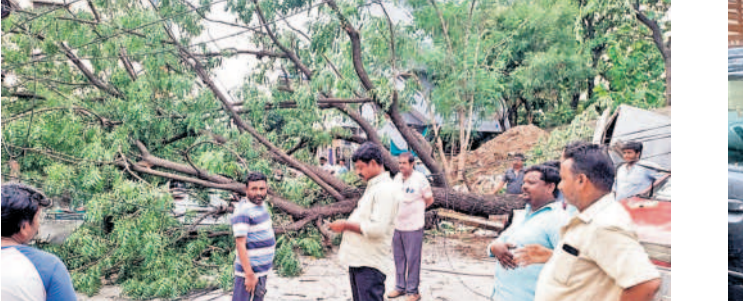
మన్యూరాబాద్ : ఇందిరానగర్ కాలనీలో నేలకొరిగిన చెట్టు

వనస్థలిపురం, మే 26 : అరగంట వచ్చిన గాలివాన శనివారం మధ్యాహ్నం బీభత్సం కన్నుంది. వనస్థలిపురం, బీపీఎన్ రెడ్డి నగర్, హస్తినాపురం ప్రాంతాల్లో వడల సంఖ్యలో చెట్లు నేలకూలాయి. కొమ్మలు రూపాదులపై పడడంతో రాకపోకలకు అంతరాయం ఏర్పడింది. సాగర్ కాంప్లెక్స్ కాలనీలో పడి చెట్టు కొమ్మలు విరిగి రహదారిపై పడ్డాయి. ఓ ఇంటిపై ఉన్న సెల్ టవర్ కూలిపోయింది. సచివాలయ నగర్ ప్రధాన రహదారిపై వేపచెట్టు కొమ్మ విరిగి పడిపోయింది. రాత్రి పరకూ తొలగించకపోవడంతో వాహనదారులు ప్రత్యామ్నాయ మార్గం వెతుక్కున్నారు. మెడికల్ హెల్త్ కాలనీ, ఎస్సీ కాలనీ, వనస్థలిపురం లలో చెట్ల కొమ్మలు విరిగి చివట్ల పడడంతో విద్యుత్ అంతరాయం ఏర్పడింది. పలు ప్రాంతాల్లో రాత్రి వరకు విద్యుత్ పునరుద్ధరణ జరుగుతోంది.