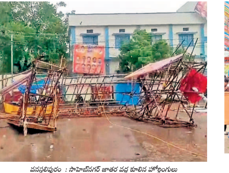
వనస్థలిపురం : సాహెబ్ నగర్ జాతర వద్ద కూలిన హోల్డింగులు