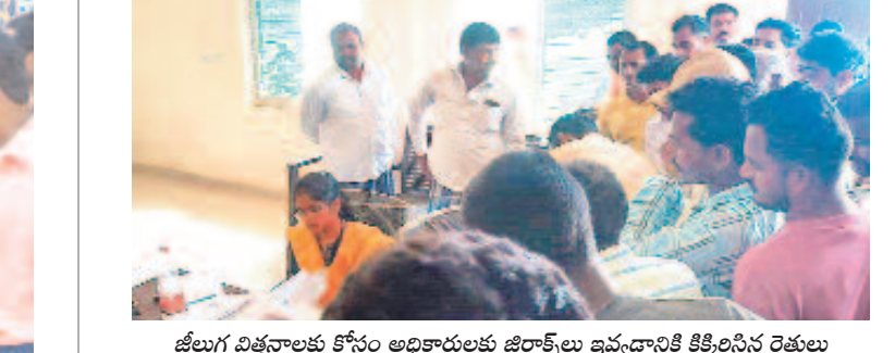
జీలుగ విత్తనాలకు కోసం అధికారులకు జిరాఫీలు ఇవ్వడానికి కిక్కిరించిన రైతులు

మల్లాపూర్ మండలం ముత్యంపేటలో వేకువజామున నుంచే నిరీక్షణ