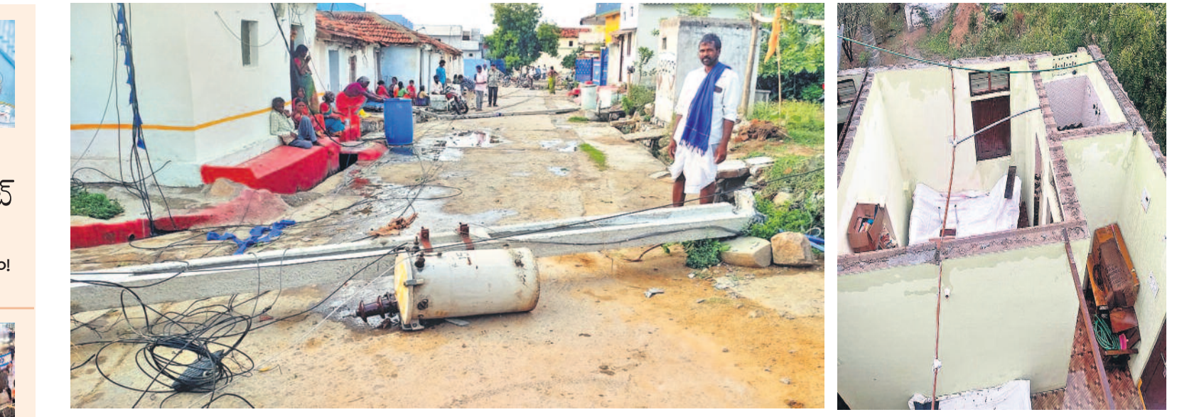
కామారెడ్డి జిల్లా బాన్సువాడ మండలం బోర్లలో ఈదురుగాలులకు వరుసగా నేలకూలిన విద్యుత్ స్తంభాలు.. మహబూబ్ నగర్ జిల్లా మూసాపేటలో గాలివానకు ఎగిరిపోయిన ఓ ఇంటి పైకప్పు