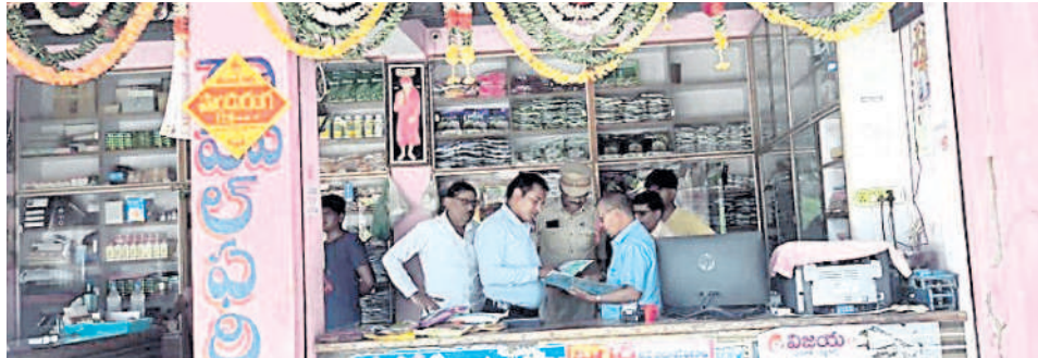
నార్కట్ లో ఎరువులు, విత్తన దుకాణంలో తనిఖీ చేస్తున్న అధికారులు

మందు స్థాయిని తెలిపే రంగులు ఉంటాయి. అత్యంత విషమూ రిత్తెనే నీలం రంగు, స్వల్ప విషమూ రిత్తెనే ఆకురంగు రంగు గుర్తులు ఉంటాయి.