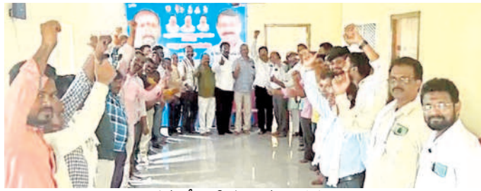
సమావేశానికి హాజరైన నాయకులు

ఎదులాపురం, మే 26 : గాంధీ సంఘం బలోపేతానికి తమవంతు కృషి చేస్తామని, ఆదిలాబాద్ జిల్లా కమిటీకి ఎల్లవేళలా అండగా ఉంటామని సంఘం రాష్ట్ర కమిటీ బాధ్యులు భరోసా కల్పించారు. ఎటువంటి సమస్యలు తలెత్తినా వాటి పరిష్కారానికి సహాయ సహకారాలు అందిస్తామని చెప్పారు. ఆదిలాబాద్ లోని బీసీ సంక్షేమ సంఘ భవనంలో ఆదివారం గాంధీ సంఘం జనరల్ బాడీ సమావేశం నిర్వహించారు. జిల్లా కమిటీ అధ్యక్షుడు ప్రధాన కార్యదర్శులు