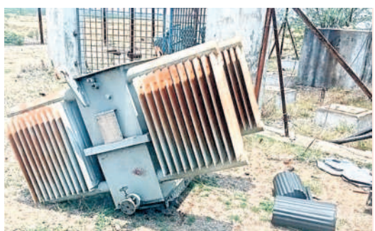
ధ్వంసం చేసిన ట్రాన్స్ఫార్మర్

లోకేశ్వరం, మే 26 : పంచగడి లిడ్ల జరిగిన సందర్భం ద్వారా ట్రాన్స్ఫార్మర్ను దుండగలు ధ్వంసం చేసి వైద్యులు దొంగలించారు. ఈ విషయం తెలుసుకున్న మామిడి గుగన్ మిర్ల మిర్ల శాఖ అధికారులు, పోలీసులకు సమాచారం అందించారు.