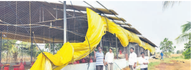
ఉప్పునంతల: రాయిచేద్లో ఈదురుగాలులకు ఎగిరిపోయిన కోళ్లపాఠశాల పైకప్పు రేకులు