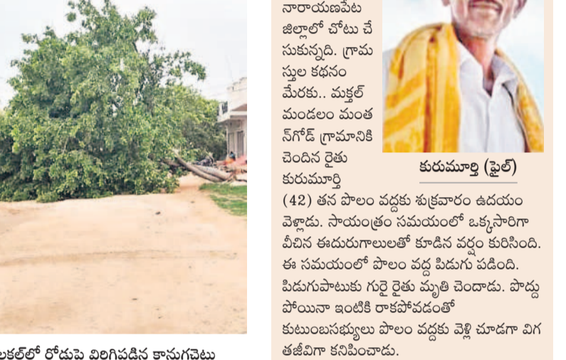
మల్లకల్లో రోడ్డుపై విరిగిపడిన కానుగచెట్టు