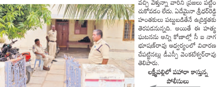
లక్ష్మీపల్లిలో పహారా కాస్తున్న పోలీసులు