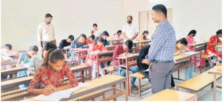
కామారెడ్డి పట్టణంలోని ఓ పరీక్షా కేంద్రాన్ని తనిఖీ చేస్తున్న కలెక్టర్, ప్రత్యేక స్కాప్ బృందం

ఎల్లారెడ్డిలోని దుకాణాల్లో తనిఖీలు ఎల్లారెడ్డి రూరల్, మే 24: దుకాణాదారులు ప్లాస్టిక్ వాడకం నిషేధించాలని ఎల్లారెడ్డి మున్సిపల్ సిబ్బంది సూచించారు. పట్టణంలోని పలు దుకాణాల్లో వారు శుక్రవారం తనిఖీలు చేపట్టారు. ప్లాస్టిక్ వాడకంతో కలిగే ఆనధాలను దుకాణాదారులకు వివరించారు. నిబంధనలు అతిథిమిస్ట్రీ జరిమానా విధిస్తామని బల్బుల కమిషన్ శ్రీహరిరాజు హెచ్చరించారు. ఎల్లారెడ్డిని ప్లాస్టిక్ రహిత పట్టణంగా తీర్చిదిద్దేందుకు పట్టణ ప్రజలు, దుకాణాదారులు సహకరించాలని కోరారు.