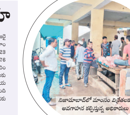
నిజామాబాద్లో మాంసం విశ్రేణి అధికారులు