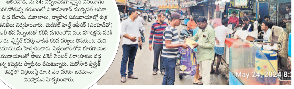
నిజామాబాద్లో పాలిథిన్ కవర్లను సాగ్లీనం చేసుకుంటున్న అధికారులు

తయారీని నియంత్రిస్తే.. ప్లాస్టిక్ వినియోగంపైనే దృష్టి సారాన్ని అధికారులు.. ఆసలు సమస్య