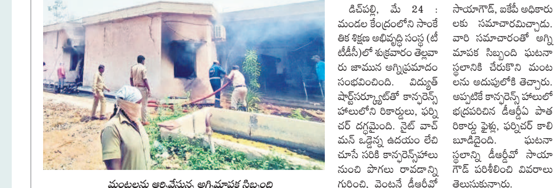
మంటలను అర్ధవేస్తున్న అగ్నిమాపక సిబ్బంది

డివీపల్లి, మే 24 : సాయగోడే, బిజినీ అధికారులు మండల కేంద్రంలోని సాంకేతిక కేంద్రం అభివృద్ధి సంస్థ (టీటీడీసీ)లో శుక్రవారం తెల్లవారుజామున అగ్నిప్రమాదం సంభవించింది. విద్యుత్ షార్ట్ సర్క్యూట్తో కాన్సర్వేషన్ హాలులోని రికార్డులు, ఫర్నిచర్ దగ్ధమైంది. వైట్ వాచ్ మన్ బడ్జెట్ను ఉదయం లేచి చూసిన సరికి కాన్సర్వేషన్ హాలు నుంచి పొగలు రావడాన్ని గుర్తించి, వెంటనే డీఆర్ఓ