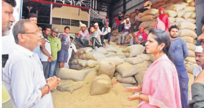
సంగారెడ్డి జిల్లా పుల్లూర్ మండలం కోడూరులోని రైసుమిల్లును సందర్శించి నిర్వాహకులతో మాట్లాడుతున్న కలెక్టర్ వల్లూరు క్రాంతి

ఉన్నాయా? తరుగు పేరుతో అదనంగా ధాన్యం తీసుకుంటున్నారా? అంటూ అడిగారు. రైతులకు ఇబ్బందులు కలుగుతూ ఉన్నాయా? అంటూ అడిగారు. రైతులకు ఇబ్బందులు కలుగుతూ ఉన్నాయా? అంటూ అడిగారు. రైతులకు ఇబ్బందులు కలుగుతూ ఉన్నాయా? అంటూ అడిగారు. రైతులకు ఇబ్బందులు కలుగుతూ ఉన్నాయా? అంటూ అడిగారు.