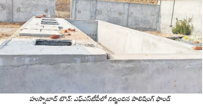
హుస్సాబాద్ టౌన్, ఎఫ్ఎస్టీపీలో నిర్మించిన పొలిడింగ్ ప్లాంట్

సిద్దిపేట జిల్లా హుస్సాబాద్ పట్టణ శివారులో ఎఫ్ఎస్టీపీ (ఫీకల్ స్ట్రెంట్ ట్రీట్ మెంట్ ప్లాంట్)ను నిర్మించేందుకు టీఎంఎఫ్ఎస్టీపీ కింద రూ.కోటిని బీఆర్ఎస్ ప్రభుత్వం మంజూరు చేసింది. ఇందులో భాగంగా సాంకేతిక ఎల్ల ముచ్చెరువు సమీపంలో ఎకరాల స్థలంలో ప్లాంట్ నిర్మాణం చేపట్టారు. ప్లాంట్లో ప్రహారీ ఆనకట్ట గది, శిక్షణ గది, అనరబిక్ స్ట్రెబిటిషన్ రియాక్టర్, స్ట్రెక్స్ డ్రైయింగ్ బెడ్స్, బ్యాక్స్ లోంగ్ ట్యాంకు, అనరబిక్ బ్యాక్ట్ రియాక్టర్ తో పాటు పలు నిర్మాణ పనులు చేప