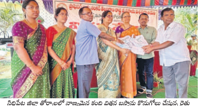
సిద్దిపేట జిల్లా తోర్నాలలో నాణ్యమైన కంది విత్తన బహిష్కరణ కోసుగోలు చేస్తున్న రైతు