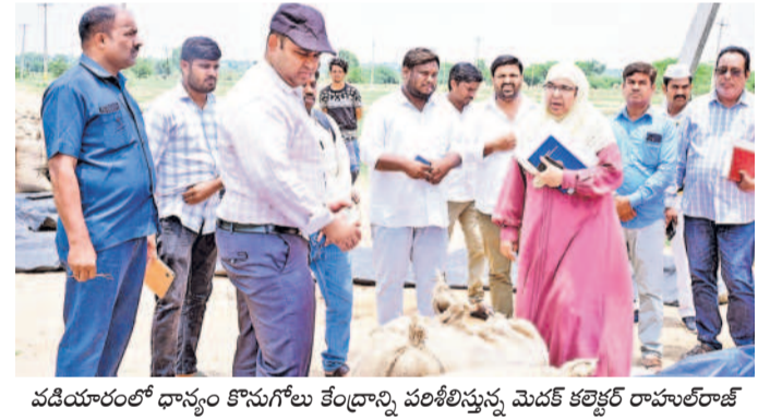
వడియాలంలో ధాన్యం కొనుగోలు కేంద్రాన్ని పరిశీలిస్తున్న మొదటి కలెక్టర్ రాహుల్ రాజ్

చేసేందుకు మే 24: కొనుగోళ్లు ముమ్మరం చేయాలని, కొనుగోళ్ల పూర్తయ్యే వరకు ప్రతి సెంటర్ పనిచేస్తుందని మొదటి జిల్లా కలెక్టర్ రాహుల్ రాజ్ పేర్కొన్నారు. చేగుంట మండలంలోని వడియాలంలో సహకార సంఘం అధ్యక్షులతో ఏర్పాటు చేసిన ధాన్యం కొనుగోలు కేంద్రాన్ని శుక్రవారం కలివ్ తనివీటి చేశారు. ఈ సందర్భంగా కలెక్టర్ తీవ్రంగా మాట్లాడుతూ వడియాలంలో కొనుగోళ్లు త్వరగా పూర్తి చేసే రైస్ మిల్లులకు తరలించాలని ఆదేశించారు. మొదటి జిల్లాలోని 34 బాయిల్డ్, 31రా మిల్లులకు ధాన్యం కేటాగోలు కేంద్రాలు ఏర్పాటు చేసి ఇప్పటి వరకు 2,35,222,040 మెట్రిక్ టన్నుల ధాన్యాన్ని 54,246 మంది రైతుల నుంచి కొనుగోలు చేశారు. 38243 కోట్ల రైతులకు చెల్లించామని 148 కేంద్రాల్లో ధాన్యం పూర్తయి