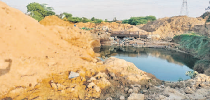
సంగారెడ్డి జిల్లా కంది మండలం బ్యాతోల్ శివారులో అక్రమ ఇసుక ఫిల్టర్

కంది, మే 24: మండలంలో కృత్రిమ ఇసుక దండా జోరగా సాగుతున్నది.. నక్క వాగు ప్రాంతంలో ఉన్న బ్యాతోల్, ఆర్డు, ఎర్లనూర్, చిల్లపూర్ యధేచ్ఛగా కృత్రిమ ఇసుకను తయారు చేసే దశారులు సామ్మ చేసుకుంటున్నారు. నిబంధనలకు విరుద్ధంగా అనుమతులు లేకుండా అసైన్డ్ భూముల్లోని మట్టిని కడిగి సానికరం ఇసుకను తయారు చేస్తున్నారని పట్టణం కలెక్షన్ కరువయ్యారు. సేస్తున్నా వట్టింతుకునేవారే కరువయ్యారు. అనుకూలంగా రెవెన్యూ, ఇరిగేషన్, ప్రజా ప్రతినిధుల అందతో వ్యాపారాన్ని జోరగా సాగిస్తున్నారు. నక్కవాగు ప్రాంతంలో తయారు చేసిన కృత్రిమ ఇసుక దిబ్బలు గుట్టలుగా దర్భంమిస్తున్నాయి. ఈ ఇసుకను గుట్టల వద్దకు కాకుండా ప్రాక్టర్, లారీలో పట్టణ ప్రాంతాలకు తరలించి విక్రయిస్తున్నారు. దశారులు కృత్రిమ ఇసుకను నది ఇసుకతో కలిపి అమ్ముతూ మోసాలకు పాల్పడుతున్నారు. కాసులు కురిపిస్తున్న అక్రమదండా