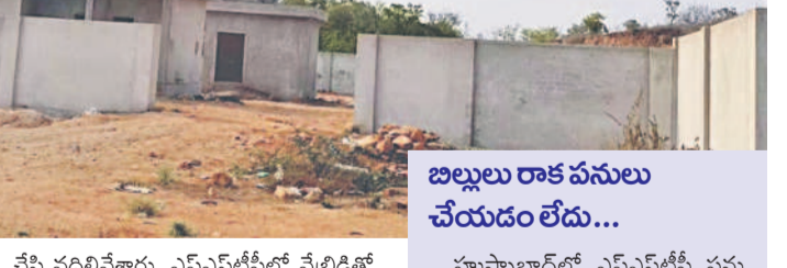
బిల్లులు రాక పనులు చేయడం లేదు...

హుస్సాబాద్ లో ఎఫ్ఎస్టీపీ పనులు మామూలు మోటు బిగించడంతో పాటు అంతర్గతంగా సీసీరోడ్డు సైతం నిర్మించాల్సి ఉంది. కానీ బిల్లులు రావడం లేదని నిర్వహణ సంస్థ పనులు చేపట్టడం లేదు. ప్రజాప్రతినిధులు పట్టించుకోవడం వల్ల ఎఫ్ఎస్టీపీ పనులు పూర్తికాలేదని పలువురు విమర్శిస్తున్నారు. మంత్రిగారు దృష్టి సారించాలి... మానవ వ్యర్థాలతో ఎరువులు తయారు చేసే వదిలివేశారు. ఎఫ్ఎస్టీపీ వేటికెక్ పని చేయాలి. ఎఫ్ఎస్టీపీ వేటికెక్ పని చేయాలి. ఎఫ్ఎస్టీపీ వేటికెక్ పని చేయాలి. ఎఫ్ఎస్టీపీ వేటికెక్ పని చేయాలి.