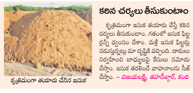
కృత్రిమంగా తయారు చేసిన ఇసుక

అక్రమంగా తయారు చేస్తున్న కృత్రిమ ఇసుక వ్యాపారం కాసులు కురిపిస్తుంది. కృత్రిమంగా తయారు చేసిన ఒక ట్రాక్టర్ ఇసుక రూ.5వేలు, ఒక లారీ రూ.35 నుంచి 40 వేల వరకు స్థానిక మార్కెట్లో విక్రయిస్తున్నారు. బయట మార్కెట్లో మేలు రకం నది ఇసుక ట్రాక్టర్ రూ.10వేలు, లారీ రూ.90 నుంచి లక్ష వరకు ధర పలుకుతుంది. కృత్రిమ