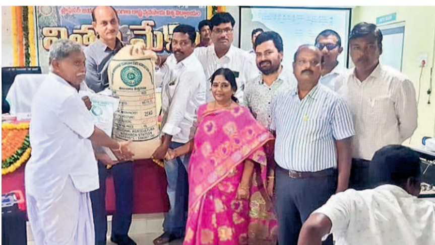
రైతులకు విత్తనాలు అందిస్తున్న అధికారులు

ప్రాంతీయ వ్యవసాయ పరిశోధనా స్థానం సహా పరిశోధన సందలకు రావుల ఉపాధి కమిషన్ కాజీబుగ్గ, మే 24 : రైతుల కోసం అధిక దిగుబడిని ఇచ్చే చీడపీడలను తట్టుకునే నూతన పరి, కంది, పెసర పంటల వంగడాలు అందుబాటులో ఉన్నాయని ప్రాంతీయ వ్యవసాయ పరిశోధనా స్థానం సహా పరిశోధన సంఘాలకు రావుల ఉపాధి కమిషన్ సూచించారు. కుకూరలపై పట్టణంలోని ప్రాంతీయ వ్యవసాయ పరిశోధనా స్థానంలో విత్తన మోశా సంకల్పంగా జ్యోతి ప్రజ్వలన చేశారు. ఈ సందర్భంగా ఆయన మాట్లాడుతూ రానున్న వర్షాకాలం పంటలకు పలు సూచనలు చేస్తూ పంట అవశేషాలను కాలపట్టుకుండా భూమిలోనే కలియదున్నాలని తెలిపారు. ప్రధాన