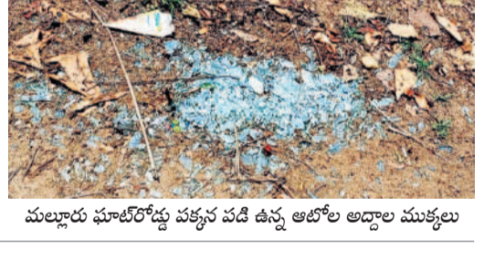
మల్లారా ఘాట్లో డ్యూ వచ్చిన పడి ఉన్న ఆటోల అడ్డాల ముక్కలు