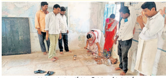
బావలితండా పాఠశాలలో ఫిలోంగ్ పనులు చేస్తున్న కూలీలు

ఉమ్మడి మండలానికి రూ. 3.71 కోట్లు నిధులు | అమ్మ ఆదర్శ పాఠశాల కమిటీల ఆధ్వర్యంలో నిర్వహణ