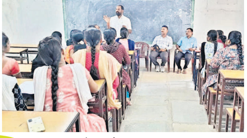
సాందీపని డిగ్రీ కళాశాలలో పాలిసెట్ పరీక్షలు అమరూపన కల్పిస్తున్న అధికారులు