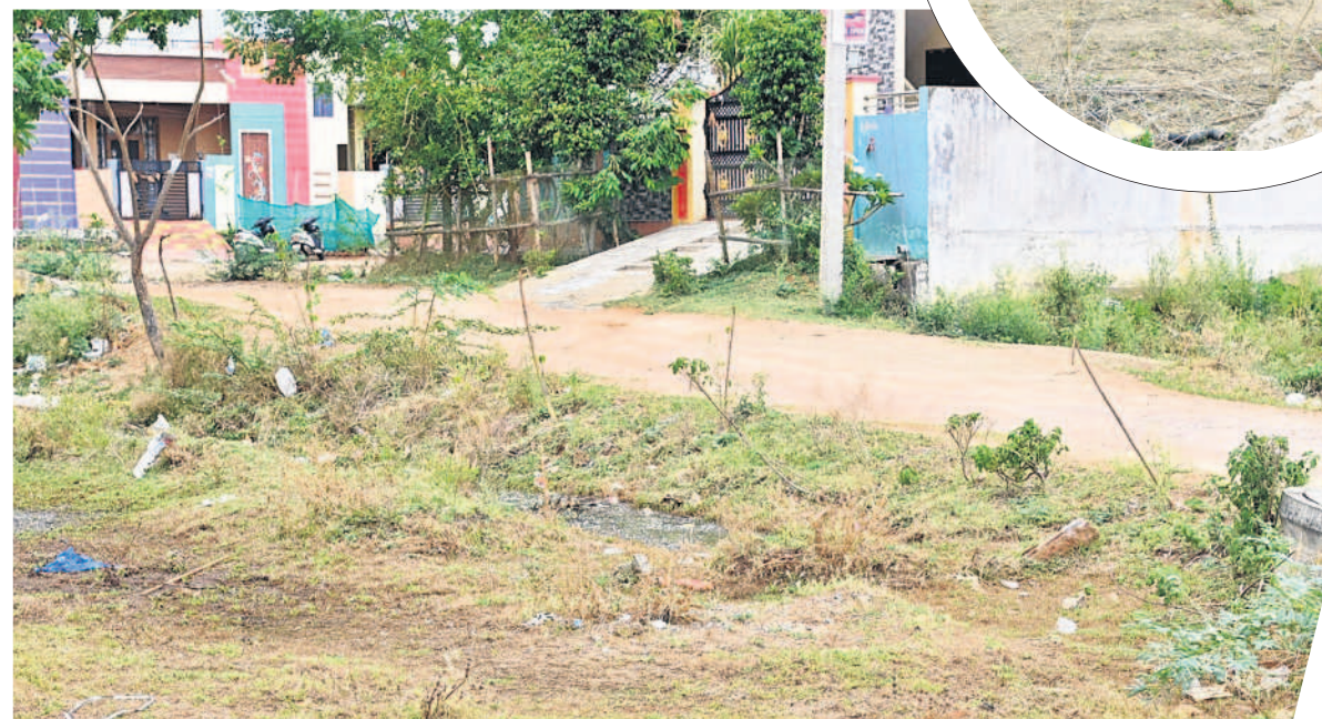
నిజామాబాద్ నగరంలోని లలితాదేవిసగర్లో ఎడగని హరితహారం మొక్కలు