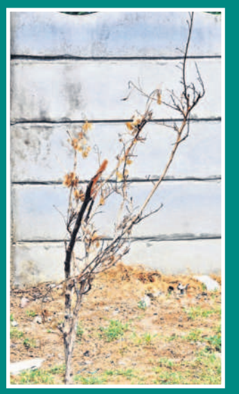
జీతీ కాలేజీకి వెళ్లే రోడ్డు పక్కన ఎండిన మొక్క