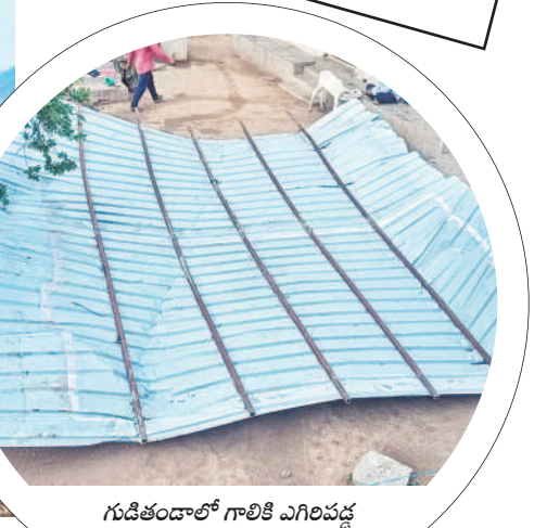
గుడిమెట్లలో గాలికి ఎగిరిపడ్డ ఇంటి పైకప్పు రేకులు