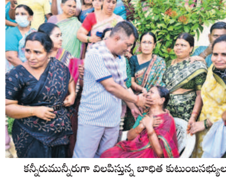
కన్నీరుమున్నీరుగా విలపిస్తున్న బాధిత కుటుంబసభ్యులు