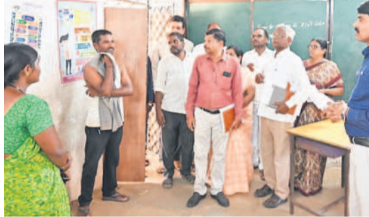
యాలాల మండల కేంద్రంలో అమ్మ ఆదర్శ పాఠశాలను పరిశీలించి సర్టిఫైడ్ మాట్లాడుతున్న కలెక్టర్ నారాయణరెడ్డి

వికారాబాద్ కలెక్టర్ నారాయణరెడ్డి యాలాల, మే 22: అమ్మ ఆదర్శ పాఠశాలకు వచ్చే నిధులను సద్వినియోగం చేసుకోవడంతో పాటు పనుల్లో నాణ్యతా ప్రమాణాలు పాటించాలని వికారాబాద్ కలెక్టర్ నారాయణరెడ్డి అధికారులను ఆదేశించారు. బుధవారం యాలాల మండల కేంద్రంలో జిల్లా పరిషత్ ఉన్నత పాఠశాల, ప్రాథమిక పాఠశాల, ఉర్దూ మాధ్యమ పాఠశాలలో అమ్మ ఆదర్శ పాఠశాలలో భాగంగా చేపడుతున్న పనులను అత్యున్నతంగా తనిఖీ చేశారు. ఈ నెల వివర వరకు పనులను పూర్తి చేయాలని అధికారులకు సూచించారు. అనంతరం ఏకరూప దుస్తులు తయారు చేస్తున్న కేంద్రాన్ని పరిశీలించి దుస్తుల తయారీలో నాణ్యత పాటించడంతో పాటు నిర్దిష్ట సమయం కంటే ముందే దుస్తులను ఇవ్వాలని స్పష్టం చేశారు. పరిశీలన కోసం కేంద్రాలను పరిశీలించి 17 శాతం తేమ ఉన్న ధాన్యాన్ని వెంటనే రైస్ మిల్లకు తరలించాలని కేంద్రాల నిర్వాహకులకు సూచించారు. కలెక్టర్ వెంట అధికారులు ఉన్నారు.