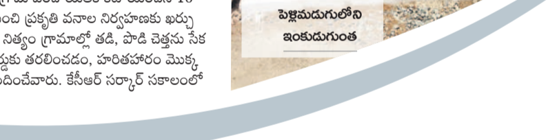
వికారాబాద్ మండలం పెళ్లమడుగులోని ఇంకా గుంత

బీఆర్ఎస్ హయాంలో జిల్లాలోని గ్రామ పంచాయతీల అభివృద్ధి రూ.700 కోట్ల నిధులు అందాయి. 2016-17 ఆర్థిక సంవత్సరంలో 80 కోట్లు, 2017-18లో రూ.32 కోట్లు, 2018-19లో రూ.23.12 కోట్లు, 2019-20లో రూ.89.05 కోట్లు, 2020-21లో రూ.128.22 కోట్లు, 2021-22లో రూ.114.22 కోట్లు, 2022-23 ఆర్థిక సంవత్సరంలో రూ.277.72 కోట్ల నిధులను కేసీఆర్ ప్రభుత్వం విడుదల చేసింది.