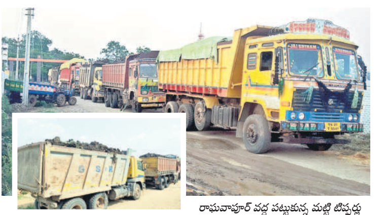
రామపాపారావు వద్ద పట్టుకున్న మట్టి బిస్తుర్లు

టల్లో బుధవారం ఏర్పాటు చేసిన విలేజ్ కలల సమావేశంలో ఆయన మాట్లాడారు. జిల్లాలో ఇంకా 2 లక్ష మెట్రిక్ టన్నుల ధాన్యం కొన్నాడని ఉన్నదని, దానిని ఎప్పుడు కొనుగోలు చేస్తారో..? ప్రభుత్వం చెప్పాలని డిమాండ్ చేశారు. సన్నబి యొక్క మాట్లాడితే ఎక్కడా లేని విధంగా కిలో ₹57 పెట్టి కొనుగోలు చేస్తున్నారని, ఈ కొనుగోళ్లలో ₹300 కోట్లకు పైగా డండుకునేందుకు ప్రయత్నాలు చేస్తున్నారని ఆరోపించారు. రాష్ట్రంలో ధాన్యం కొనుగోలుకు సంబంధించి 33 లక్షల మెట్రిక్ టన్నుల సేకరణ లక్ష్యంగా టెండర్ పిలిచారని, కానీ ఇప్పటి వరకు రెండు లక్షల మెట్రిక్ టన్నులు మాత్రమే కొనుగోలు చేశారన్నారు. ఈ టెండర్ పొడిగించి వేరీటే ₹700 కోట్లు డండు కొనాలని ధాన్యం సభ్యులు డిమాండ్ చేశారు. టెండర్ను పట్టి పరిస్థితుల్లోనూ పొడిగించవద్దని డిమాండ్ చేశారు. డిస్ట్రిక్ ఉన్నతాధికారులకు ఫిర్యాదు చేస్తామని ఆరోపించారు. కాంగ్రెస్ నేత రాహుల్ గాంధీకి ఎంత మొత్తం ముఖ్యమంత్రిని విషయంలోనే మంతులు పోటీ పడుతున్నారని ఆరోపించారు. ఎంత సేపు తమకు వచ్చే కమిషన్లపైనే ధ్యానం తప్ప రైతుల సమస్యలను పట్టించుకోవడం లేదని ధ్వజమెత్తారు. సమావేశంలో బీఆర్ఎస్ నాయకులు కూడా జనమంతుల హరిప్రసాద్, తిరుపతి పోల్డన్నార్లు.