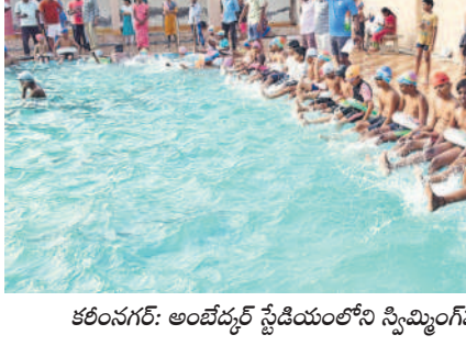
కరీంనగర్: అంబేద్కర్ స్టేడియంలోని స్విమ్మింగ్ పూల్ లో చిన్నారులు