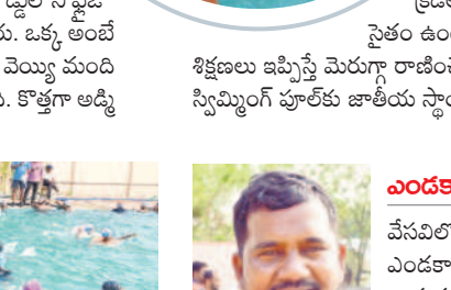
- అంబేద్కర్ సీనియర్ సస్పెన్షన్ శిక్షకుడు (కరీంనగర్)

ఎండకాలంలో పూల్ రన్ వేసవిలో స్విమ్మింగ్ ట్రైనింగ్ కు విపరీతమైన ఆదరణ ఉంటుంది. ఎండకాలం నెలపూర్తి పూల్ రన్ గా ఉంటుంది. మిగతా రోజుల్లో నామమాత్రంగా ఉంటుంది. ఏప్రిల్, మే రెండు నెలల కాలంలో అంబేద్కర్ స్టేడియంలోని స్విమ్మింగ్ పూల్ లో సుమారు మియ్యం మంది శిక్షణ తీసుకున్నారు. ఆరోగ్యంతో పాటు ఆహారానికి స్విమ్మింగ్ ను ఆశ్రయిస్తున్నారు. ఇతర ప్రాంతాల నుంచి వేసవి సెలవులు గడిపేందుకు నగరానికి వచ్చే వారు స్విమ్మింగ్ నేర్చుకుంటున్నారు.