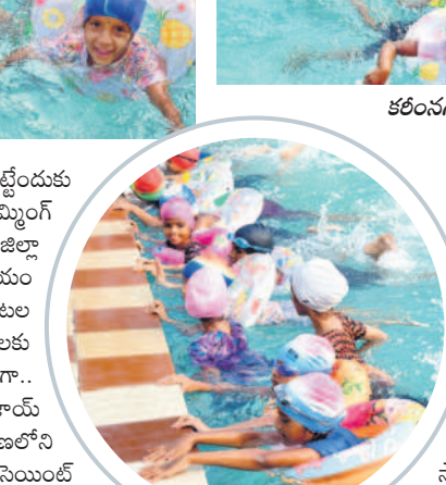
కరీంనగర్: అంబేద్కర్ స్టేడియంలోని స్విమ్మింగ్ పూల్ లో ఈ క్రీడకున్న చిన్నారులు

స్విమ్మింగ్ తో ఆరోగ్యం నిరంతరం స్విమ్మింగ్ చేయడం ద్వారా శారీరకంగా, మానసికంగా ఆరోగ్యంగా ఉండవచ్చు. ఆస్తిక ఉన్నతాధికారుల స్విమ్మింగ్ నిరంతరం సాధన చేయడం ద్వారా రాష్ట్ర జాతీయ స్థాయిలో రాజీనామా చేశాడు. ఈ క్రీడలో రాజీనామా చేసిన ప్రభుత్వ ఉద్యోగంలో రిటైర్డ్ వన్ సైతం ఉంటుంది. పిల్లలకు చిన్నప్పటి నుంచే వారికి చిన్న క్రీడలో శిక్షణలు ఇచ్చే మెరుగైన రాజీనామా అవకాశముంటుంది. స్టేడియం ఆవరణలోని స్విమ్మింగ్ పూల్ కు జాతీయ స్థాయి స్విమ్మింగ్ పోటీలు నిర్వహించే స్థాయి ఉన్నది.