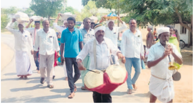
జూలపల్లి : కుమ్మరికుంటలో పట్టు పన్నెండు, తలంబ్రాలు తీసుకువస్తున్న భక్తులు