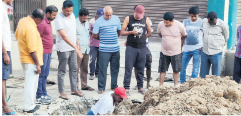
పైపులైన్ మరమ్మత్తు పనులను పరిశీలిస్తున్న నగర పాలక సంస్థ కమిషనర్