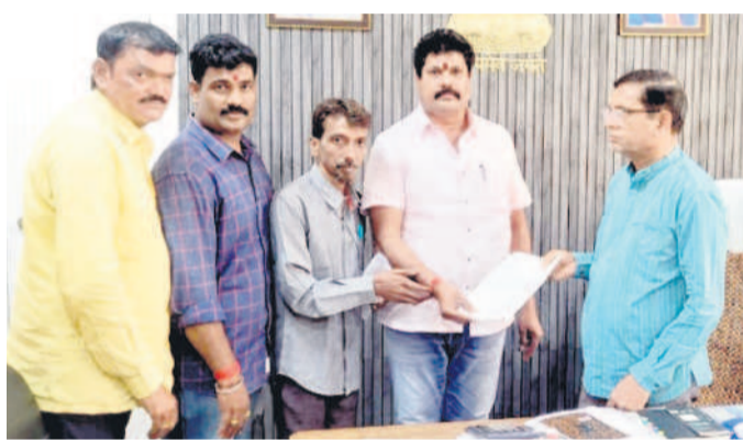
జిల్లా అదనపు కలెక్టర్ కు వినపత్తం అందిస్తున్న జీఆర్ఎస్ నాయకులు