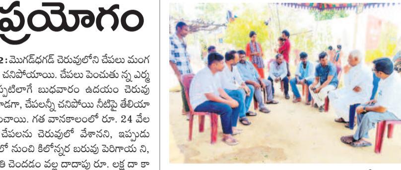
కుటుంబ సభ్యులను పరామర్శిస్తున్న మాజీ ఎమ్మెల్యే