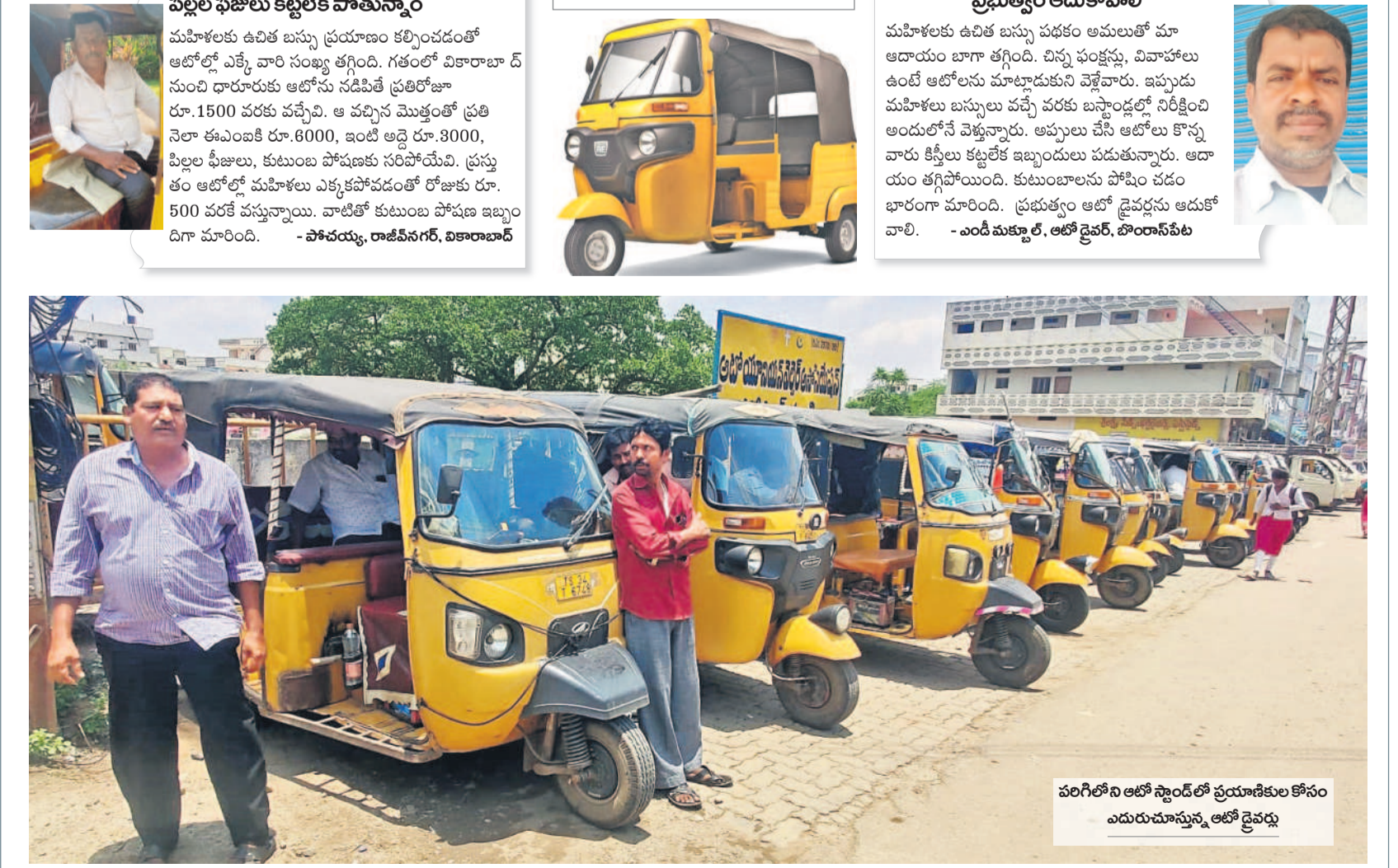
పరిగిలోని ఆటో స్టాండ్ లో ప్రయాణికుల కోసం ఎదురుచూస్తున్న ఆటో డ్రైవర్లు