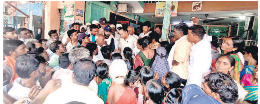
విత్తన దుకాణంలో వ్యవసాయశాఖ అధికారులతో రైతుల వాగ్వివాదం