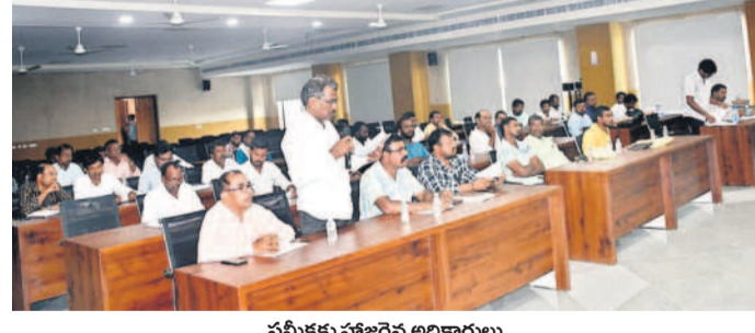
సమీక్షకు హాజరైన అధికారులు