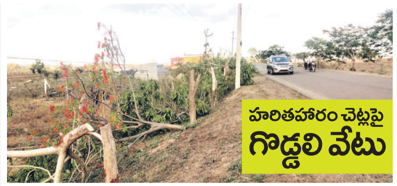
బజార్ హాత్మూర్ రోడ్డుకు ఇరువైపులా చెట్లను నరికిన విద్యుత్ అధికారులు

కేసీఆర్ సర్కారు హరితహారంలో భాగంగా కోట్లాది మొక్కలను నాటింది. అది పెరిగి పెద్దవై పండ్లు, నీడను ఇస్తున్నాయి. రహదారులకు ఇరువైపులా నాటి, త్రోగార్లు దిద్దాలి చేసి, నీటిని అందించడంతో దిద్దుగా పెలగాయి. రహదారుల వెంట వైద్య ప్రజలు, వాహనదారులకు నీడను ఇస్తున్నాయి. ఇటువంటి చెట్లపై కాంగ్రెస్ సర్కారు కన్నీటిని చిల్లించి, కనీసం నీరు కూడా పోయడం లేదు. ఫలితంగా మొక్కలు ఎండిపోతున్నాయి. పెరిగిన చెట్లను కూడా విద్యుత్ శాఖ అధికారులు కరెంటు తీగలకు అడ్డంకు ఉన్నాయని వందలాది చెట్లను నరుకుతున్నారు. తాజాగా ఆదిలాబాద్ జిల్లా బజార్ హాత్మూర్ మండలంలోని గిర్నూర్ గ్రామ సమీపంలో ఇన్ఫోడ-సోనాల వైద్య ప్రధాన ఆఫీసర్ రహదారికి ఇరువైపుల ఉన్న చెట్లను నేలపాటి దర్శనమిస్తున్నాయి. కాంగ్రెస్ ప్రభుత్వం చెట్లపై చిన్న చూపు చూడడంతో ప్రత్యేక ప్రేమికులు మండిపడుతున్నారు. ఉన్నతాధికారులు, ప్రభుత్వం ప్రత్యేక చర్యలు తీసుకుని చెట్లను నరికే వయకుండా చూడాలని కోరుతున్నారు. - బజార్ హాత్మూర్, మే 20