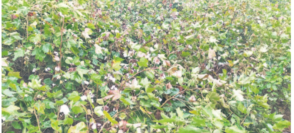
సాగుతున్న పత్తి (ఫైల్)

నిర్మల్, మే 20(నమస్తే తెలంగాణ) : నిర్మల్ జిల్లావ్యాప్తంగా 4,33,900 ఎకరాల్లో పత్తి, వరి, మక్కా, సోయా, పప్పు దినుసులు పండించేందుకు వ్యవసాయ శాఖ అధికారులు ప్రణాళిక రూపొందించారు. అవసరమైన విత్తనాలు, ఎరువులను అందుబాటులో ఉంచేందుకు చర్యలు తీసుకుంటున్నారు. రాష్ట్ర విత్తనాభివృద్ధి సంస్థ ద్వారా వరి, కంది, పెసర, మినుము విత్తనాలును అందించేందుకు ఏర్పాట్లు చేసింది. అలాగే పత్తి, సోయా విత్తనాలను కూడా అందుబాటులో ఉంచారు. పత్తి 1.68 లక్షల ఎకరాలు, వరి 1.35 లక్షల ఎకరాలు, సోయా లక్ష ఎకరాలు, మక్కా 18 వేల ఎకరాలు, కందులు 10 వేల ఎకరాలు, 1000 ఎకరాల్లో మినుములు, పెసర్లు, ఇతర పంటలు సాగు చేసేందుకు ప్రణాళికలు రూపొందించారు. వరి సాగును తగ్గించి, పత్తి పంటతోపాటు మార్కెట్లో డిమాండ్ ఉన్న పంటల వైపు రైతును ప్రోత్సహించే ప్రయత్నాలు చేస్తున్నారు.