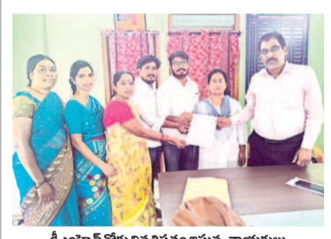
డిఎంహెచ్ఓకు విస తివర్తం ఇస్తున్న నాయకులు