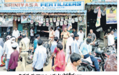
విత్తన దుకాణాల ఎదుట పోలీసులు

అందుబాటులో ఉండకపోవడంపై రైతులు పలు అనుమానాలు వ్యక్తం చేస్తున్నారు. మరో పదిహేను రోజుల్లో వానకాలం సీజన్ ప్రారంభం కానుండడంతో రైతులు విత్తనాలు వేస్తారు. ఇందుకోసం తమ భూముల్లో మంచి దిగుబడి ఇచ్చే విత్తనాలను ఎంచుకుంటారు. గతంలో కొన్ని విత్తనాల డిమాండ్ ఉండగా ఈ సారి సమస్య రాకుండా చూడాలన్న బాధ్యత అధికారులపై ఉంటుంది. గత గురువారం కలెక్టర్ రాజు షా వ్యవసాయ శాఖ అధికారులు, విత్తనాలు, ఎరువుల డిలెటర్ల సమావేశం నిర్వహించి విత్తనాల కొరత లేకుండా చర్యలు తీసుకోవాలని సూచించారు. వ్యాపారుల వద్ద పత్తి విత్తనాల స్టాక్ ఉన్నా విక్రయంపడం లేదని రైతులు అంటున్నారు. డిమాండ్ ఉన్న విత్తనాలను భాక్స్ చేసి అధిక ధరలకు అమ్ముతున్నారని అంటున్నారు. వానకాలం సాగుకు రైతులు సన్నద్ధం అవుతుండగా, ప్రారంభంలోనే విత్తనాల సమస్య నెలకొన్నది. ఈ ఏడాది సాగు అన్నదాతల్లో ఆందోళన కలిగిస్తున్నది.