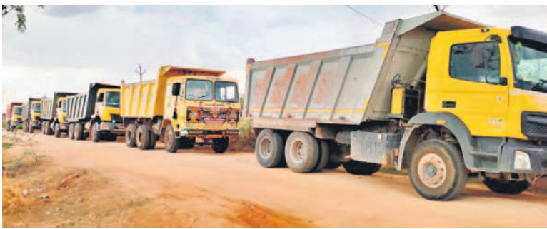
గ్రామస్థులు అడ్డుకోవడంతో నిలిచిన టిప్పర్లు