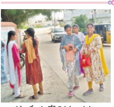
పరజా కేంద్రంలోకి వెళ్తున్న అభ్యర్థులు

రోడ్డు ద్వారా సమస్యలు వస్తున్నదని మండిపడ్డారు. ఇసుక అక్రమ రవాణాపై ఇదివరకే అధికారులకు ఫిర్యాదు చేసినా పట్టించుకోవడం లేదని గ్రామస్థులు, రైతులు వాపోయారు. ప్రజాప్రతినిధులు, అధికారుల ఆండోళ్లనే ఇసుకను భాహుళంగా తీస్తున్నారని, గుండూర్ సమీపంలోని దుందుభి వాగునుంచి ఇసుకను తీయడాన్ని తాము ప్యూరిటీకామిటీ గ్రామస్థులు తేల్చి చెప్పారు. గ్రామస్థులు అడ్డుకోవడంతో దాదాపు 40 ఇసుక టిప్పర్లు నిలిచిపోయాయి.