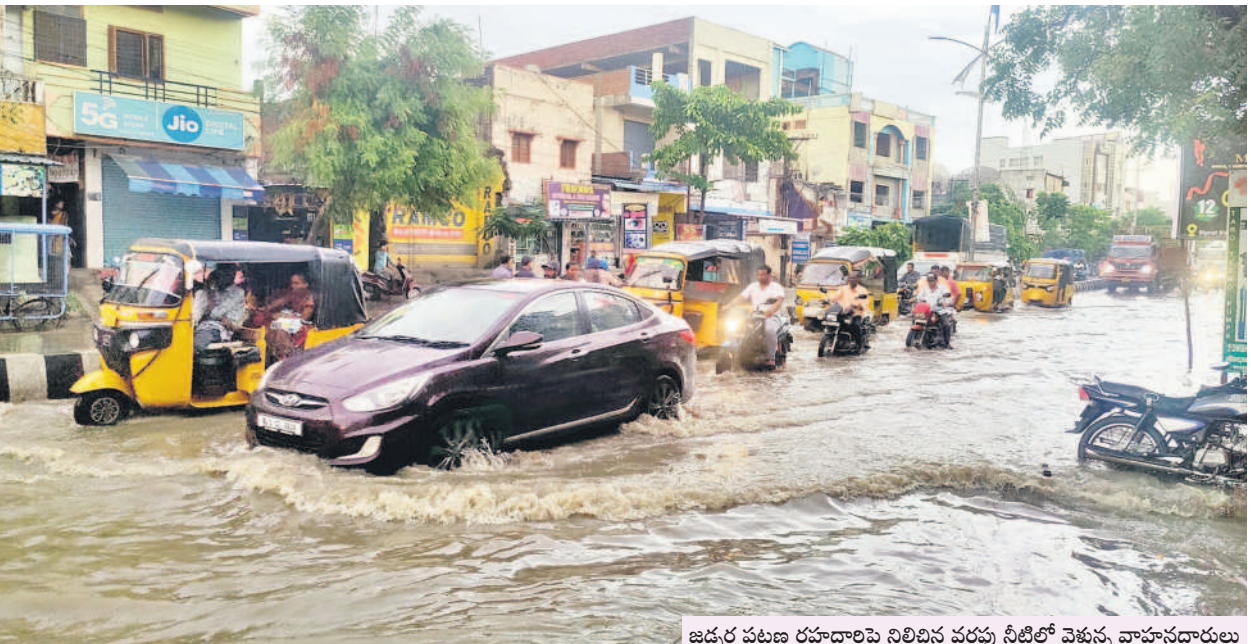
జడ్చర్ల పట్టణ రహదారిపై నిలిచిన వర్షపు నీటిలో వెళ్తున్న వాహనదారులు