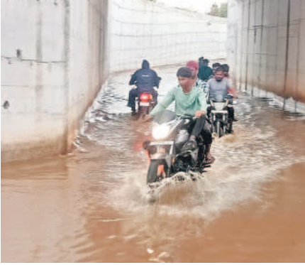
జడ్చర్ల మండలం ఆలూర్ గ్రామానికి వెళ్ళే రైల్వే అండర్ పాస్ వద్ద నిలిచిన వర్షపు నీటిలో వెళ్తున్న వాహనదారులు

జడ్చర్ల టౌన్/ఉండవెల్లి/తిమ్మాజిపేట/అచ్చంపేట టౌన్/నాగర్ కర్నూల్, మే 20 : జడ్చర్ల పట్టణంలో సోమవారం కురిసిన అకాల వర్షానికి రోడ్డునీటి జలమయమయ్యాయి. ఈదురుగాలులు, ఉరుములు, మెరుపులతో వర్షం కురవగా లోతట్టు ప్రాంతాలైన వెంకటేశ్వరకాలనీ, శివాజీనగర్, రాజీవ్ నగర్, బొవెలకుంట ప్రాంతాల్లో నీరు భారీగా చేరింది. మార్కెట్ యార్డులోని ధాన్యం బస్తాలు లాల్లోకి ఎక్కి నాగర్ కర్నూల్ వెళ్ళే దారిలో ఇంద్రానగర్, తంజడ్చర్ల పై టువర్, పట్టణ ప్రధాన రహదారిపై, ఆలూర్ రైల్వే అండర్ పాస్ వద్ద నిలిచిన వాహనాల రాకపోకలకు ఇబ్బందులు కలిగాయి. రైల్వే అండర్ పాస్ లో వర్షపు నీరు నిలవ