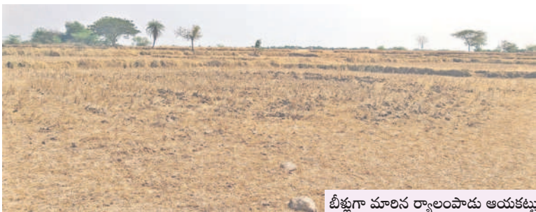
బీళ్లుగా మారిన ర్యాలంపాడు ఆయకట్టు

105, 106, 107, 108 ప్యాకేజీల కుడి కాల్వలు 1,11,000 ఎకరాలు, 104 ఎడమ కాల్వ ప్యాకేజీ కింద 25వేల ఎకరాలు, కుడి కాల్వ కింద తాటి కుంట రిజర్వాయర్ 1.5 టీఎంసీలు, నాగర్లొడ్డి రిజర్వాయర్ 0.6 టీఎంసీలు, ముప్పోనిపల్లి రిజర్వాయర్ 1.5 టీఎంసీలు, చిన్నోనిపల్లి రిజర్వాయర్ 1.5 టీఎంసీల సామర్థ్యంతో ర్యాలంపాడు, సద్దలోనిపల్లి, మల్లకల్, అయిజ, మేడికొండ, గట్టు, ఆ రిగిడ్ల, చమన్పానీదొడ్డి, టిటిదొడ్డి, చాగోణ, భూంపురం, వడ్డేపల్లి, రాజోళి మండలాల రైతులకు 48 కిలోమీటర్ల మొత్తం కెనాల్ ద్వారా సాగునీటిని సరఫరా చేస్తున్నారు. 104 ప్యాకేజీ 5 కిలోమీటర్ల మొత్తం కెనాల్ కేటీడొడ్డి, ధరూరు మండలాలకు సాగునీటిని సరఫరా చేస్తున్నాయి.