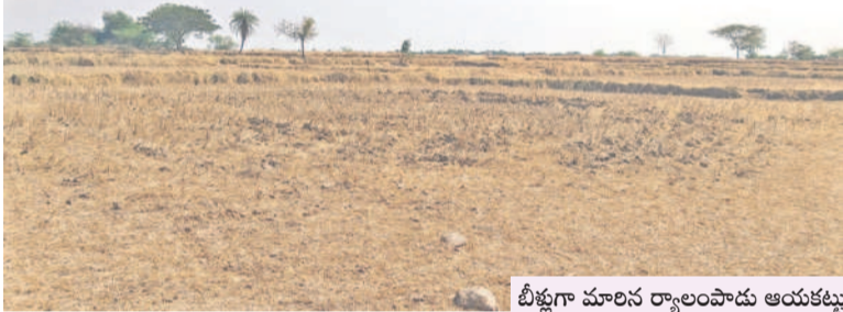
వీళ్లుగా మారిన ర్యాలంపాడు ఆయకట్టు

ర్యాలంపాడు ఆయకట్టు వివరాలు.. 105, 106, 107, 108 ప్యాకేజీల కుడి కాల్వలు 1,11,000 ఎకరాలు, 104 ఎడమ కాల్వల ప్యాకేజీ కింద 25వేల ఎకరాలు, కుడి కాల్వల కింద తాటి కుంట రిజర్వాయర్ 1.5 టీఎంసీలు, నాగర్లపాడి రిజర్వాయర్ 0.6 టీఎంసీలు, ముప్పోనిపల్లి రిజర్వాయర్ 1.5 టీఎంసీలు, చిన్నోనిపల్లి రిజర్వాయర్ 1.5 టీఎంసీల సామర్థ్యంతో ర్యాలంపాడు, సద్దలోనిపల్లి, మల్లకల్, అయిజ, మేడికొండ, గట్టు, ఆ రిగిద్ద, చమన్పానడొడ్డి, టిటిడొడ్డి, చాగణోబ, భూంపురం, వడ్డెపల్లి, రాజోళి మండలాల రైతులకు 48 కిలోమీటర్ల మొయిన కెనాల్ ద్వారా సాగునీటిని సరఫరా చేస్తున్నారు. 104 ప్యాకేజీ 5 కిలోమీటర్ల మొయిన కెనాల్ కేటిడొడ్డి, ధరూరు మండలాలకు సాగునీటిని సరఫరా చేస్తున్నాయి.