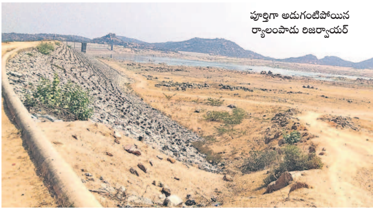
పూర్తిగా అడుగంటిపోయిన ర్యాలంపాడు రిజర్వాయర్