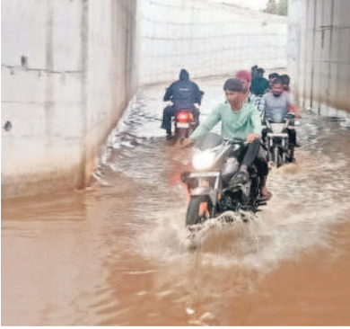
జడ్చర్ల మండలం ఆలూర్ గ్రామానికి వెళ్లే రైల్వే అండర్ పాస్ వద్ద నిలిచిన వర్షపు నీటిలో వెళ్తున్న వాహనదారులు

జడ్చర్ల టౌన్/ఉండవెల్లి/తిమ్మాజిపేట/అచ్చంపేట టౌన్/నాగర్ కర్నూల్, మే 20 : జడ్చర్ల పట్టణంలో సోమవారం కురిసిన అకాల వర్షానికి రోడ్లన్నీరు జలమయమయ్యాయి. ఈదురుగాలులు, ఉరుములు, మెరుపులతో వర్షం కురవగా లోతట్టు ప్రాంతాల్లో వెంకటేశ్వరకాలనీ, శివాజీనగర్, రాజీవ్ నగర్, బొవెలకుంట ప్రాంతాల్లో నీరు భారీగా చేరింది. మార్కెట్ యార్డులోని ధాన్యం బస్తాలు లాల్లోకి ఎక్కి నాగర్ కర్నూల్ వెళ్లే దారిలో ఇంద్రానగర్, తంజడ్చర్ల పై టువర్, పట్టణ ప్రధాన రహదారిపై, ఆలూర్ రైల్వే అండర్ పాస్ వద్ద నిలిచిన వాహనాల రాకపోకలకు ఇబ్బందులు కలిగాయి. రైల్వే అండర్ పాస్ లో వర్షపు నీరు నిలవ