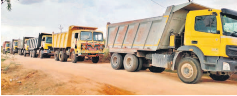
గ్రామస్థులు అడ్డుకోవడంతో నిలిచిన టిప్పర్లు