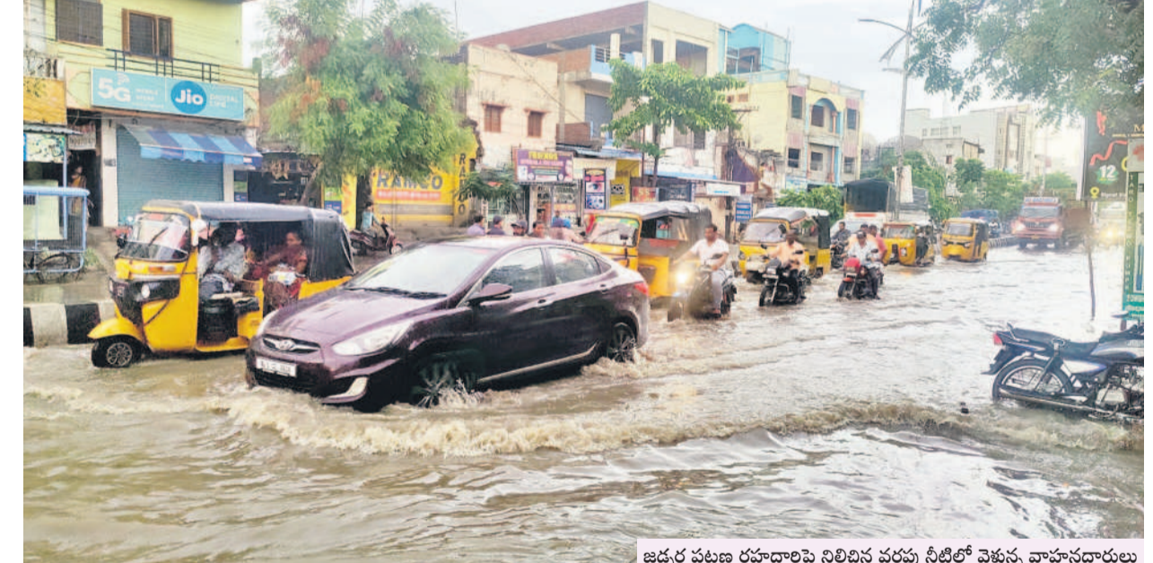
జడ్చర్ల పట్టణ రహదారిపై నిలిచిన వర్షపు నీటిలో వెళ్తున్న వాహనదారులు