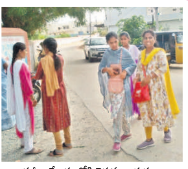
పరజా కేంద్రంలోకి వెళ్తున్న అభ్యర్థులు

రోడ్డు ద్వారా సమస్యలు వస్తున్నదని మండిపడ్డారు. ఇసుక అక్రమ రవాణాపై ఇదివరకే అధికారులకు ఫిర్యాదు చేసినా పట్టించుకోవడం లేదని గ్రామస్థులు, రైతులు వాపోయారు. ప్రణాళితీరులు, అధికారుల అండతోనే ఇసుకను భాహుళంగా తీస్తున్నారని, గుండూర్ సమీపంలోని దుందుభి వాగునుంచి ఇసుకను తీయడాన్ని తాము పట్టించుకోవాలని గ్రామస్థులు తెల్లీ చెప్పారు. గ్రామస్థులు అడ్డుకోవడంతో దాదాపు 40 ఇసుక టిప్పర్లు నిలిచిపోయాయి.