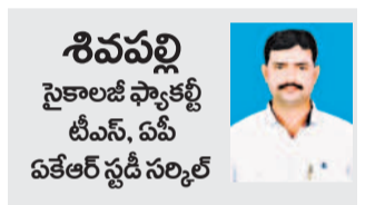
శివవల్లి సైకాలజీ స్పాకల్జి టీసీసీ, ఏపీ ఏకేఆర్ స్టడీసెల్లర్

వీర్యస్పృశం ప్రారంభమవుతుంది. గోణ లైంగిక లక్షణాలు ఇంకా అభివృద్ధి చెందే దశలోనే ఉంటాయి. ఉత్తర యువనారంభ దశ లైంగిక భాగాలు పరిపక్వత చెంది, గోణ లైంగిక లక్షణాలు భాగా అభివృద్ధి చెంది పనిచేయడం ప్రారంభిస్తాయి. ఇది బాల్య దశను కొనసాగించే కలిషిత దశ వ్యక్తి జీవితంలో అతి వేగవంతమైన పెరుగుదల, శిశువు జనన పూర్వదశలో, యువనారంభ దశలో జరుగుతుంది. ఈ దశ అందరిలో ఒకే వయస్సులో ప్రారంభం కాదు. దీనిలో వైయక్తిక భేదాలుంటాయి. లైంగిక పరిపక్వత పూర్తికానే ఈ దశ అంతమవుతుంది. పిల్లల పెరుగుదలలో భాగంగా అన్ని దశల్లో కంటే ఎక్కువ రూపాన్ని అనుభవించే దశ. ఈ దశలో సడత తీరు మారి సిగ్గు, బిడియం ఉస్తుంది. ఈ దశలో తీవ్రమైన మానసిక ఒత్తిడి ఉంటుంది. ఈ దశలో నిర్లక్ష్యం, రక్తాసక్త మొదలైన లక్షణాలు కనిపిస్తాయి. కొమార దశ కొమారదశను ఆంగ్లంలో Adolescence అని అంటారు. Adolescence అనే ఆంగ్ల పదం Adolere అనే Latin పదం నుంచి ఉద్భవించింది. Latin భాషలో Adolere అంటే "To Grow into Maturity (పరిపక్వత చెందడం/ పరిపక్వత చేరడం కావడం) ఈ దశలోని వారిని Adolescent అంటారు. ఈ దశని 1) టీనేజ్ దశ 2) సందిగ్ధ దశ 3) ఒత్తిడి, ఒడిదుడుకుల దశ 4) పునరుత్పత్తి దశ 5) యువనావిరూపన దశ 6) సమస్యలతో కూడిన దశ 7) కీకర్ ప్రాచీన దశ 8) గుర్తువు కోరుకోనే దశ 9) పగటి కలలు కోనే దశ 10) భిన్న లైంగికత వల్ల ఆకర్షణ దశ అని అంటారు.