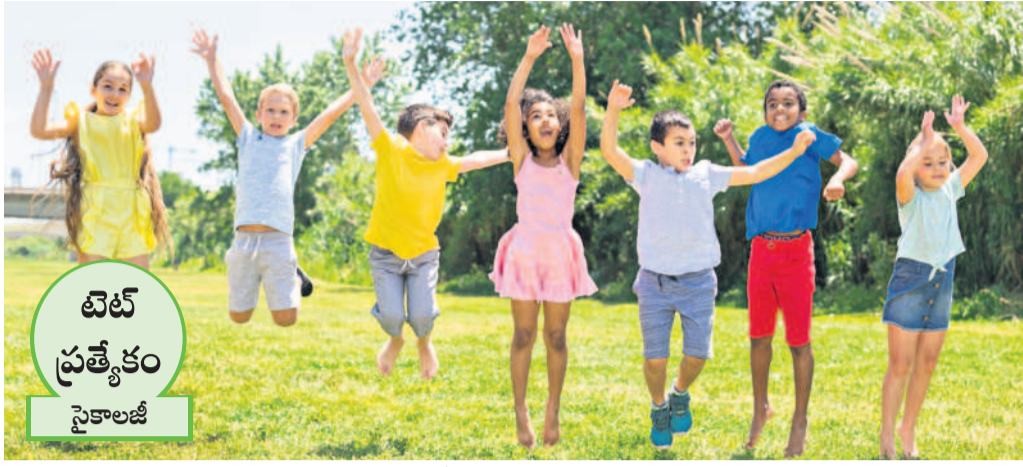
టెల్ ప్రత్యేకం సైకాలజీ

బాల్యదశ బాల్యదశ ముఖ్యంగా రెండు దశలుగా విభజించవచ్చు. అవి 1) పూర్వ బాల్యదశ 2) ఉత్తర బాల్యదశ పూర్వబాల్యదశ (Early Childhood) ఈ దశ 2 నుంచి 5/6 సంవత్సరాల వరకు ఉంటుంది. ఈ దశను పూర్వ పాఠశాల దశ పూర్వ మూలా దశ, ప్రస్థిత వయస్సు దశ అని అంటారు. ఈ దశనే విజ్ఞాన తృప్తిగల దశ, అన్వేషించే వయస్సు గల దశ అని కూడా అంటారు. ఈ దశలో శాశ్వత దంతాలు ఏర్పడతాయి. Child is the father of man – పేక్స్టెయిర్ శారీరక వికాసం శారీరక వికాసం క్రమేణ దశలో వేగంగా జరగడం నిదానంగా జరుగుతుంది. సగటున సంవత్సరానికి 3 అంగుళాల పొడవు, 2 కేజీల బరువు పెరుగుతారు. లావుగా, బలిష్ఠంగా, ఇలహీనంగా ఉండే లక్షణాలున్న పిల్లలు ఈ దశలో ఉంటారు. ఈ దశ ప్రారంభంలో చివరి 4 పాల దంతాలు వస్తాయి. ఈ దశలో చివరిలో పాల దంతాలు ఊడిపోవడం ప్రారంభమై వాటిస్థానంలో శాశ్వత దంతాలు రావడం ప్రారంభమవుతుంది. శరీరాన్ని ఎటువైపునా వంచగలరు. కాబట్టి చలన ప్రయోగాలు అనువైన దశ ఈ దశ చివరికి బొమ్మలు గీయడం, రాయడం వంటి సూక్ష్మ ప్రయోగాలు, కుండం, సిగ్నలింగ్, స్పెలింగ్, రోవ్ వాకింగ్ వంటి స్థూల ప్రయోగాలు నేర్చుకుంటారు. ఈ దశ పిల్లలు సాహస ప్రయోగాలు కాబట్టి ఎటువంటి కృత్యమైనా చేయగలరు. మానసిక వికాసం: మానసిక వికాసం వేగంగా జరిగే దశ పరిశీలన, ఆలోచన, వివేచన, దృష్టి కేంద్రీకరణ, గ్రహణ శక్తి, ప్రత్యక్ష శక్తులు పిల్లల్లో పెరుగుతాయి. కానీ ఇవి మూర్త రూపంలోనే ఉంటాయి. ఉద్యోగ వికాసం ఈ దశలో ఉద్యోగాలు శిశువుల్లో ధారాపాతంగా వస్తాయి. పిల్లల్లో అసమతుల్యత వల్ల ఉద్యోగాలు తొందరగా ఉత్పన్నమవుతాయి. అసూయ, ఈర్ష్య ప్రారంభమవుతుంది.