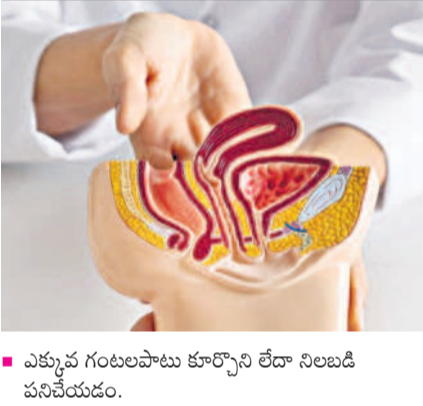
ఎక్కువ గంటలపాటు కూర్చోని లేదా నిలబడి పనిచేయడం.

పైల్స్ మలద్వారం పట్టు నుంచి మక్క నీరు కూడా బయటికి రాకుండా గేట్ కీపర్స్ లాగా అడ్డుపడుతాయి. మలద్వారం నుంచి నీరు బయటికి రాకుండా పైల్స్ 20 శాతం వరకు అడ్డుకుంటాయి. మిగతా 80 శాతం స్నిగ్ధ అడ్డుకుంటాయి. ఇక ఎవరికైనా పైల్స్ సమస్య తలెత్తినప్పుడు కొన్ని ఇబ్బందులు వస్తాయి. అవి... మలద్వారం వద్ద కొప్పి, బయటికి మొలలలాగా రావడం, రక్తం కారడం, మలం బయటికి రాకుండా అడ్డుపడటం, ఫిస్టులా, పిషర్ కూడా రావచ్చు! ఎసిడిటీ కారణంగా కడుపులో మంట మొదలైనవి పీడిస్తాయి. స్త్రీలలో డ్రైగ్రాస్టీ సమయంలో కూడా పైల్స్ రావచ్చు. ఎందుకంటే మలద్వారం పైనే బిడ్డ ఒత్తిడి పడటం దీనికి కారణమవుతుంది.