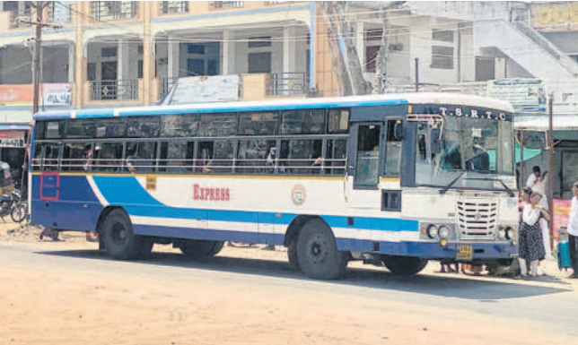
బస్టాండ్ లోకి వెళ్లకుండా రూరాలపై నిలిపి ప్రయాణికులను ఎక్కించుకుంటున్న ఆటోస్ బస్సు