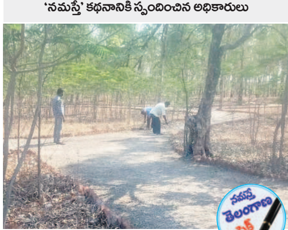
'నమస్తే' కథనానికి స్పందించిన అధికారులు