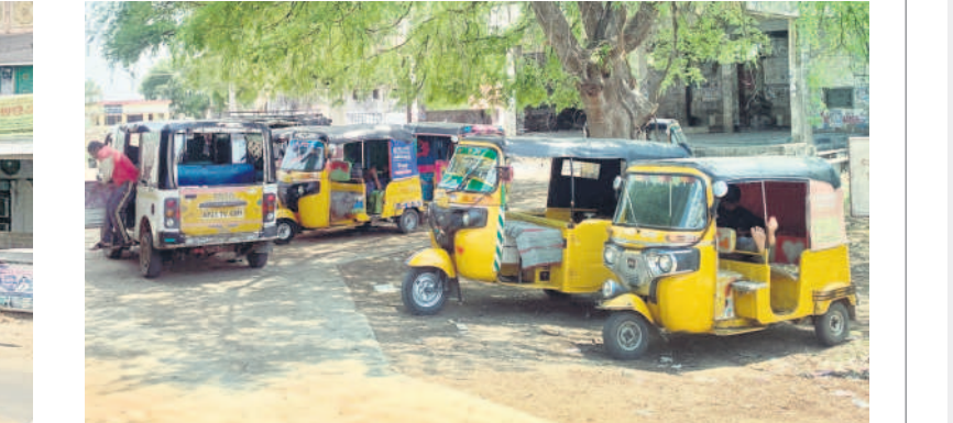
బస్టాండ్ ముందు నిలిపివే ఆటోలు

నాగిరెడ్డిపేట, మే 20 : మండల కేంద్రంలోని గోపాల్ పేట్ బస్టాండ్ లోకి ఆటోస్ బస్సులు వెళ్లకుండా.. ప్రయాణికులు తీవ్ర ఇబ్బందులు పడుతున్నారు. ఆరు నెలలుగా ఏ ఒక్క ఆటోస్ బస్సు బస్టాండ్ లోకి వెళ్లడం లేదు. ప్రధాన రహదారిపైనే నిలుపుతుండడంతో ప్రయాణికులు బస్టాండ్ ను విడిచి రహదారికి ఇరుప్రక్కలా బెడదలు కోసం గంటలకొద్దీ నిరీక్షిస్తున్నారు. కొన్నిసార్లు బస్సులు ఆపకుండా వెళ్తుండడంతో తాము తీవ్ర ఇబ్బందులు ఎదుర్కొంటున్నామని ప్రయాణికులు ఆవేదన వ్యక్తం చేస్తున్నారు. ఆటోస్ కి మండల కేంద్రంలో రెండు ఎకరాల స్థలం ఉండగా.. అధికారులు నిర్ల