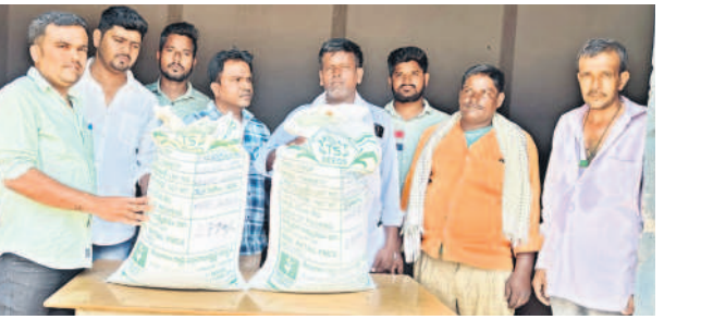
జీలుగ విత్తనాల పంపిణీ చేస్తున్న వ్యవసాయశాఖ అధికారులు