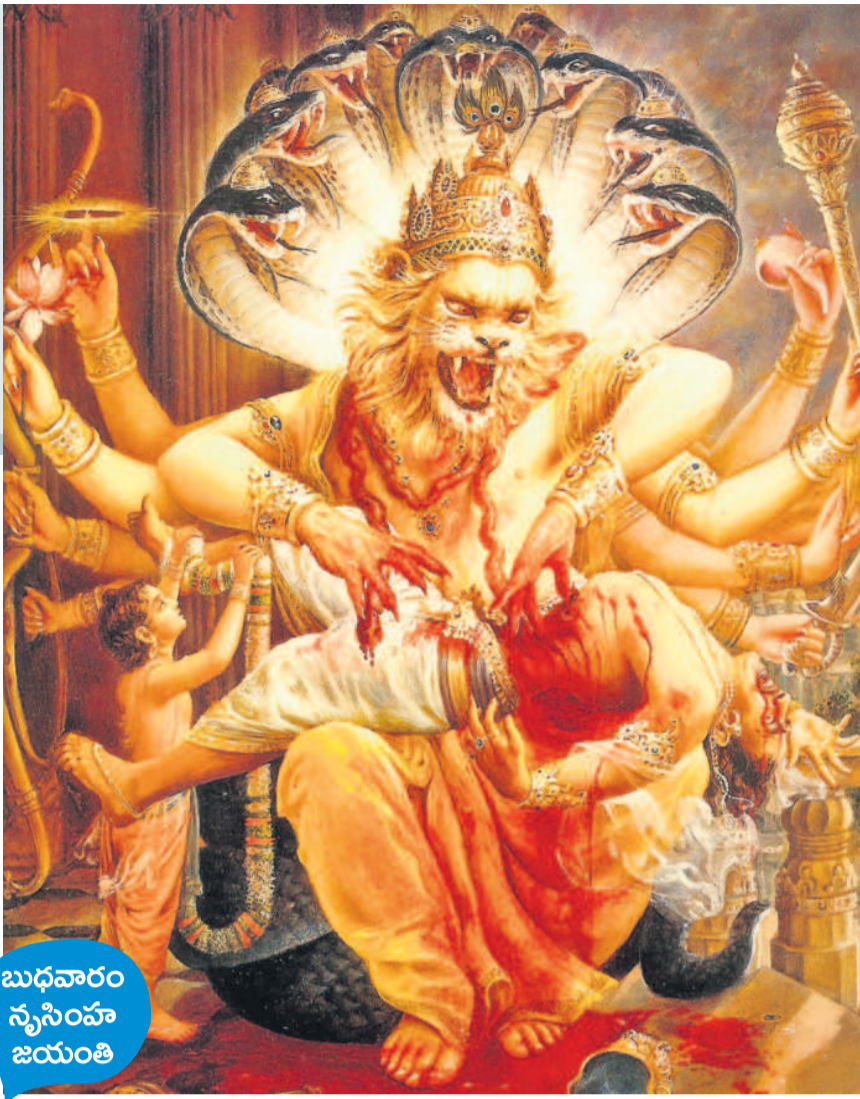
బుధవారం న్యూసింహ జయంతి