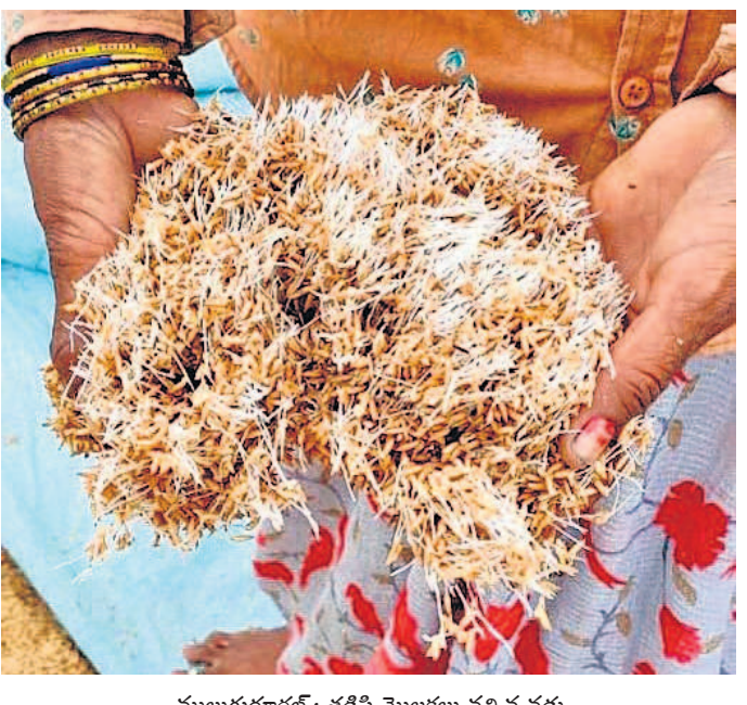
ములుగురూర్: తడిని మొలకలు వచ్చిన వడ్లు

మిల్లర్లతో బేరసారాలు ధాన్యం ఎత్తడంలో బిడ్డర్లు కావాలనే నిర్లక్ష్యంగా వ్యవహరిస్తున్నారనే ఆరోపణలున్నాయి. బహిరంగ మార్కెట్లో ధాన్యం విలువ పడిపోవడంతో ఇప్పుడు ధాన్యం ఎత్తడం వ్యవస్థపై ఆరోపణలు వారు ఉన్నట్లు తెలిసింది. అందుకే కాలయాపన చేస్తున్నారనే విమర్శలున్నాయి. దీనిని తోడు ధాన్యం ఎత్తడం, ట్రాన్స్ పోర్ట్ పెట్టి ఎక్కడో విక్రయించడం.. ఇలాంటి తలనొప్పుల కన్నా.. ఎక్కడి ధాన్యం అక్కడి ఉంచేసి పెద్దపై అమ్మకాన్ని చూపించేవిధంగా బిడ్డర్లు ప్లాన్ చేసినట్లు ఆరోపణలు వినిపిస్తున్నాయి. ఇందులో భాగంగానే ధాన్యం ఉన్న మిల్లర్లతో బిడ్డర్ల బేరసారాలు సాగిస్తున్నట్లు తెలిసింది. 'మీ ధాన్యం మీ దగ్గరే ఉంచుకోండి. ఆ ధాన్యానికి ఎంత ధర అవుతుందో అంత మొత్తం మాకు చెల్లించండి' అంటూ ప్రతిపాదనలు వస్తున్నట్లు మిల్లర్ల వర్గాలు వెల్లడించాయి. ఒకవేళ మిల్లర్ల వద్ద ధాన్యం లేకుంటే ముక్కుపిండి మరి అందుకు సంబంధించిన డబ్బులను వసూలు చేస్తున్నట్లు తెలిసింది. ఈ విధంగా ధాన్యం ఎత్తకుండానే ఎక్కడి ధాన్యం అక్కడి ఉండగానే మొత్తం కార్యక్రమం పూర్తి చేసే విధంగా భారీ స్కెచ్ వేసినట్లు ఆరోపణలు వినిపిస్తున్నాయి.