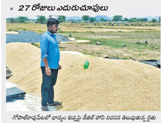
గోపాల్ రావుపేటలో ధాన్యం కుప్పపై డిజిల్ పోసి నిరసన తెలుపుతున్న రైతు

హైదరాబాద్, మే 19 (నమస్తే తెలంగాణ): రాష్ట్ర ప్రభుత్వం నిర్లక్ష్యం వహించడంతో రాష్ట్రంలో రైతులు తీవ్ర సంక్షోభాన్ని ఎదుర్కొంటున్నారని జీవో జాతీయ ప్రధాన కార్యదర్శి బండి సంజయ్ విమర్శించారు. సోమవారం జరిగే క్యాబినెట్ సమావేశంలో రైతులను ఆదుకునేలా నిర్ణయాలు తీసుకోవాలని ఆయనకు ఆజ్ఞాపించారు. తేమ లేకుండా ఉండే వేళాల్లో ఆరబోసిన ధాన్యం ప్రభుత్వం విఫలమైందన్నారు. వడ్లును సకాలంలో కొనుగోలు చేయకపోవడంతో రైతులు కొనుగోలు కేంద్రాల వద్ద నిరాదానీయంగా మారి పడిపోతున్నారని ఆయన ఆవేదన వ్యక్తం చేశారు. ఐదారు రోజులపాటు వర్షాలు కురుస్తాయని వాతావరణ శాఖ ముందస్తు సమాచారం ఇచ్చినా వడ్లు కొనుగోలు వేగవంతం చేయకపోవడం, ధాన్యం కేంద్రాల వద్ద వడ్లు తడవకుండా కనీసం పౌర ర్యాలు కల్పించకపోవడం దుర్భాగమని మండిపడ్డారు. తాలు, తరుగు, తేమతో సంబంధం లేకుండా కనీస మద్దతు ధర చెల్లించి ధాన్యాన్ని కొనుగోలు చేయాలని సీఎం రేంజెర్లతో ఆడి రోలినా, క్షేత్రస్థాయిలో అధికారుల కపోవడం విచారకరమన్నారు. సన్న వడ్లు రూ. 500 బోనస్ ఇవ్వాలని ప్రభుత్వం భావిస్తున్నట్లు వస్తున్న వార్తలు రైతులను మరింత ఆందోళన గురిచేస్తున్నాయన్నారు. దీనిపై స్పష్టత ఇవ్వాలని డిమాండ్ చేశారు.