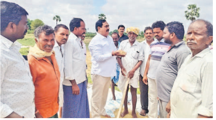
పాలకర్తి: తడిని పొరబెట్టి దయాకరంగా

వికారాబాద్ జిల్లాలో పిడుగుపడి ముగ్గురి మృతి అందోల్/శివ్వంపేట/చిన్నకరంపేట/యాలాల, మే 19: ఉమ్మడి మెదక్ జిల్లాలో ఆదివారం వర్షాలపై మోస్తూ నుంచి భారీ వర్షం కురిసింది. కల్లాలు, రోడ్లపై ఆరబెట్టిన ధాన్యం తడిసి రైతులు ఇబ్బందులు ఎదుర్కొన్నారు. కొనుగోలు కేంద్రాల్లో సైతం ధాన్యం తడిసింది. మెదక్ జిల్లా శివ్వంపేట మండల కేంద్రంలోపాటు పలు గ్రామాల్లో భారీ వర్షం కురిసింది. శివ్వంపేట కొనుగోలు కేంద్రం వద్ద ధాన్యం కుప్పపై కప్ప కప్ప వేయడంతోపాటు అక్కడ వరదనీరు నిలుచుండా రైతులు పారలతో కాలువలు తవ్వారు. కొనుగోలు కేంద్రాల్లో అధికారుల కన్నా కొనుగోలు చేయాలని రైతులకు అధికారులను వేడుకుంటున్నారని మెదక్ జిల్లా చిన్నకరంపేట మండలంలోని వివిధ గ్రామాల్లో రాత్రి ఈదురు గాలులు వీచారు. చందాపూర్ గ్రామం శివారులో ఈదురుగాలికి గొనుగోలు కేంద్రం, మండలంలోని అంబాజిపేట, దుర్గారం, ఇప్పటికే కనీస మద్దతు ధరను ప్రకటించకుండా తాత్కాలికం చేసినందుకు విమర్శించారు.