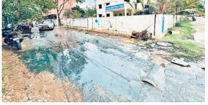
మండల పరిషత్ కార్యాలయం వద్ద రోడ్డుపై పారుతున్న డైనేజీ నీరు

కొత్తూరు, మే 18: ఎంపీడీవో కార్యాలయం ఎదురు మురుగునీరు ఆరు నెలలుగా పొంగి పొరుతున్నది. దీంతో ఎంపీడీవో, తహసీల్దార్ కార్యాలయాలకు వచ్చే ప్రజలు మ్యూన్ మరంత పొంగింది. మ్యూన్ హోల్ లుగా మ్యూన్ హోల్ పొంగి పొరుతున్నా మున్సిపల్ అధికారులు పట్టణంలోని వడం లేదు. శనివారం మండల ప్రజాపరిషత్