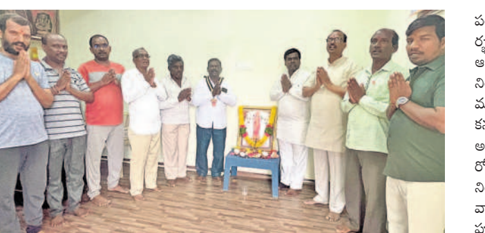
వానవీ కన్యకా పరమేశ్వరి చిత్రపటానికి నివాళి అర్పిస్తున్న ఆర్కవైశ్యులు