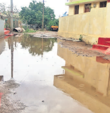
వేవై రూరల్: అంతారంలోని 2వ వార్డు రోడ్డులో నిలిచిన వర్షం నీరు

నిద్రమవుతున్నాయి. జోరుగా జోన్న, పత్తి కంది తదితర పంటల విత్తనాలు వేయడం