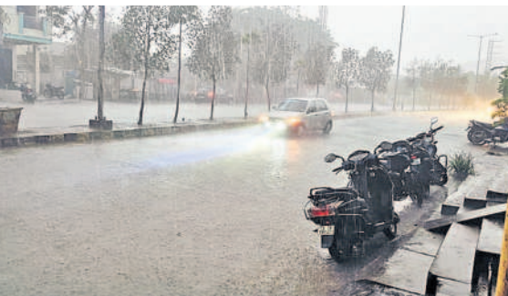
యాచారంలో కురుస్తున్న భారీ వర్షం

యాచారం, మే 18 : మండలంలో శనివారం సాయంత్రం భారీ వర్షం కురిసింది. చిరు జల్లులతో మొదలైన వాన కుండపోతగా మారింది. దీంతో రోడ్లన్నీ జలమయమయ్యాయి. లోతట్టు ప్రాంతాలు నీటితో నిండిపోయాయి. కొత్తపల్లి, మార్, యాచారం, మేడపల్లి తదితర గ్రామాల్లో ఇండ్లలోకి వర్షం నీరు వచ్చి చేరింది. డైనేజీలు పొంగి పొరాయి. మండలంలోని మేడపల్లి, కుర్నెపల్లి, తాటిపల్లి, నజ్జీనింగారం, నందివనపల్లి, నాన కిన్ గర్, మల్కొన్నగూడ, తాటిపల్లి, యాచారం, మార్ తదితర గ్రామాల్లో సుమారు రెండు గంటల పాటు భారీ వర్షం కురిసింది. దీంతో విద్యుత్ సరఫరా అంతాయం ఏర్పడింది. గ్రామాల్లో విద్యుత్ లేక అంధకారం