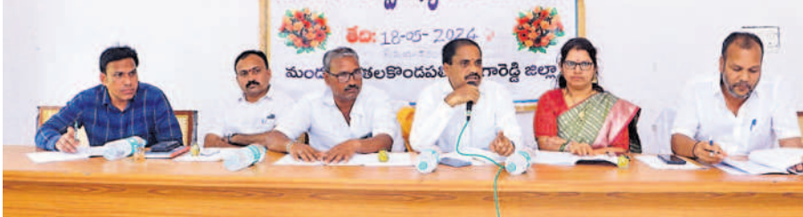
కడూల్ : మండల సర్వసభ్య సమావేశంలో మాట్లాడుతున్న ఎమ్మెల్యే కసిరెడ్డి నారాయణరెడ్డి

మండల సర్వసభ్య సమావేశంలో ఎమ్మెల్యే కసిరెడ్డి నారాయణరెడ్డి