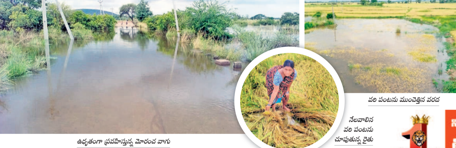
ఉధృతంగా ప్రవహిస్తున్న మోరంబ వాగు