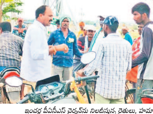
ఇంచర్ల పీపీసీఎస్ చైర్మన్ ను నిలబెట్టుతున్న రైతులు, హమాల్లు

మరో 20 రోజుల్లో కోతలు పూర్తి చేసి ధాన్యాన్ని విక్రయించే సమయంలో వర్షాలు తమ పాలిట శాపంగా మారాయని రైతులు ఆవేషన వ్యక్తం చేస్తున్నారు. గణపవరం మండలకేంద్రంతో పాటు కొండాపూర్, ధర్మారావుపేట, నగరంపల్లి, చెల్వూర్, బుద్ధారం, మైలారం పంట నీట మునిగడంతో రైతులకు కోలకోలేని దెబ్బ తగిలిందన్నారు. దీనికోసం కొనుగోలు కేంద్రాలకు