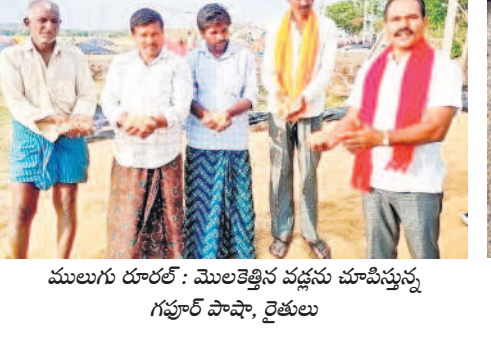
ములుగు రూరల్ : మొలకెత్తిన వడ్డును చూపిస్తున్న గృహం పాపా, రైతులు

కేంద్రాన్ని సందర్శించి కాంటాలు వేసిన ధాన్యాన్ని రైస్ మిల్లులకు తరలించాలని ఆదేశించారు. అయినా కొనుగోలు కేంద్రం నిర్వాహకులు పట్టించుకోలేదు. సాయంత్రం ఒక లారీ ధాన్యపు బస్తాలను తరలించేందుకు కొనుగోలు కేంద్రం వద్దకు రాగా గతంలో ధాన్యాన్ని తరలించిన ఒక లారీ యజమాని మూడు రోజుల క్రితం ఎగుమతికి బాజాలపల్లి రైస్ మిల్లుకు పంపించగా అక్కడ వారు దిగుమతి చేసుకోవడం లేదని, వెయిటింగ్ కిరాయిలు పడుతున్నాయని తెలిపారు. దీంతో రైతులు రైస్ మిల్లర్లతో మాట్లాడించిన