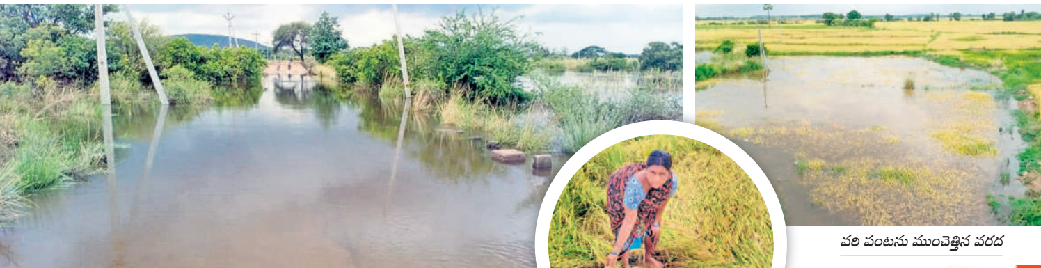
ఉధృతంగా ప్రవహిస్తున్న మోరంబ వాగు | వల వంటను ముంచెత్తిన వరద | నేలవాలిన వల వంటను చూపుతున్న రైతు