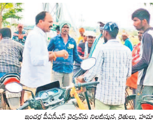
ఇంచర్వ పీసీఎస్ వైద్యశన నిలబిస్తున్న రైతులు, హమాల్లు

మరో 20 రోజుల్లో కోతలు పూర్తి చేసి ధాన్యాన్ని విక్రయించే సమయంలో వర్షాలు తమ పాలిట శాపంగా మారాయని రైతులు ఆవేషం వ్యక్తం చేస్తున్నారు. గణపవరం మండలకేంద్రంతో పాటు కొండాపూర్, ధర్మారావుపేట, నగరంపల్లి, చెల్వూర్, బుద్ధారం, మైలారం వంటి పంట నీల మునిగడంతో రైతులకు కోలకోలేని దెబ్బ తగిలిందన్నారు. దీనికోసం కొనుగోలు కేంద్రాలకు