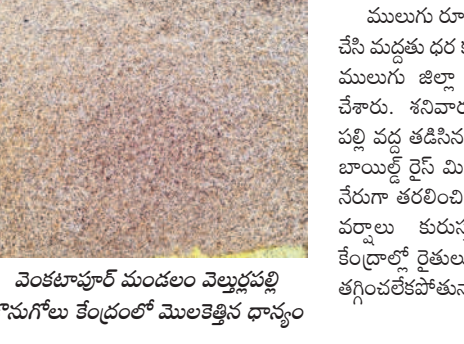
వెంకటాపూర్ మండలం వెల్లూర్లపల్లి కొనుగోలు కేంద్రంలో మొలకెత్తిన ధాన్యం

వల కొసిన వెంటనే కొనుగోలు చేయాలి ములుగు రూరల్ : వరి కొసిన వెంటనే కొనుగోలు చేసే మద్దతు ధర కల్పించాలని తెలంగాణ రైతు సంఘం ములుగు జిల్లా కార్యదర్శి గృహం పాపా డిమాండ్ చేశారు. శనివారం ఆయన మండలంలోని జంకాల పల్లి వద్ద తడిసిన వడ్డును పరీక్షించారు. అధికారులు బాయిల్డ్ రైస్ మిల్లర్లతో మాట్లాడి కొసిన తడి వడ్డును నేరుగా తరలించి కొనుగోలు చేపట్టాలన్నారు. అలా వర్షాలు కురుస్తున్నందున ధాన్యం కొనుగోలు కేంద్రాల్లో రైతులు ధాన్యాన్ని ఆరబోసే తేమ శాతాన్ని తగ్గించలేకపోతున్నారని తెలిపారు.