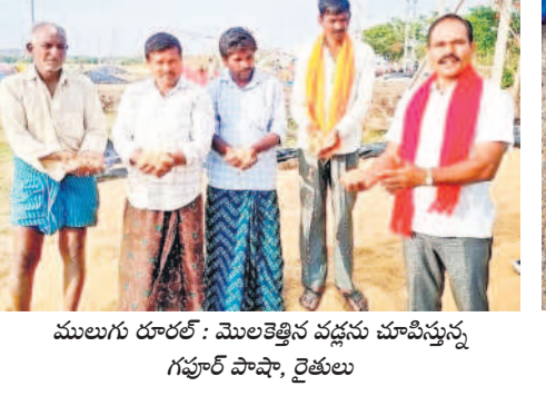
ములుగు రూరల్ : మొలకెత్తిన వడ్డును హమాల్లను గూర్చి పాపా, రైతులు

కేంద్రాన్ని సందర్శించి కాంటాలు వేసిన ధాన్యాన్ని రైస్ మిల్లుకు తరలించాలని ఆదేశించారు. అయినా కొనుగోలు కేంద్రం నిర్వాహకులు పట్టించుకోలేదు. సాయంత్రం ఒక లారీ ధాన్యపు బస్తాలను తరలించేందుకు కొనుగోలు కేంద్రం వద్దకు రాగా గతంలో ధాన్యాన్ని తరలించిన ఒక లారీ యజమాని మూడు రోజుల క్రితం ఎగుమతికి బాజాలపల్లి రైస్ మిల్లుకు పంపించగా అక్కడ వారు దిగుమతి చేసుకోవడం లేదని, వెయిటింగ్ కిరాయిలు పడుతున్నాయని తెలిపారు. దీంతో రైతులు రైస్ మిల్లర్లతో మాట్లాడించిన