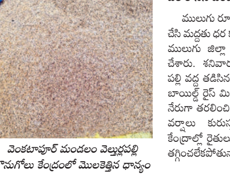
వెంకటాపూర్ మండలం వెల్లూర్లపల్లి కొనుగోలు కేంద్రంలో మొలకెత్తిన ధాన్యం