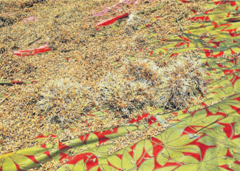
కామారెడ్డి మండలం క్యాంపస్ లో ఆరబోసిన వడ్డుకు వచ్చిన మొలకలు