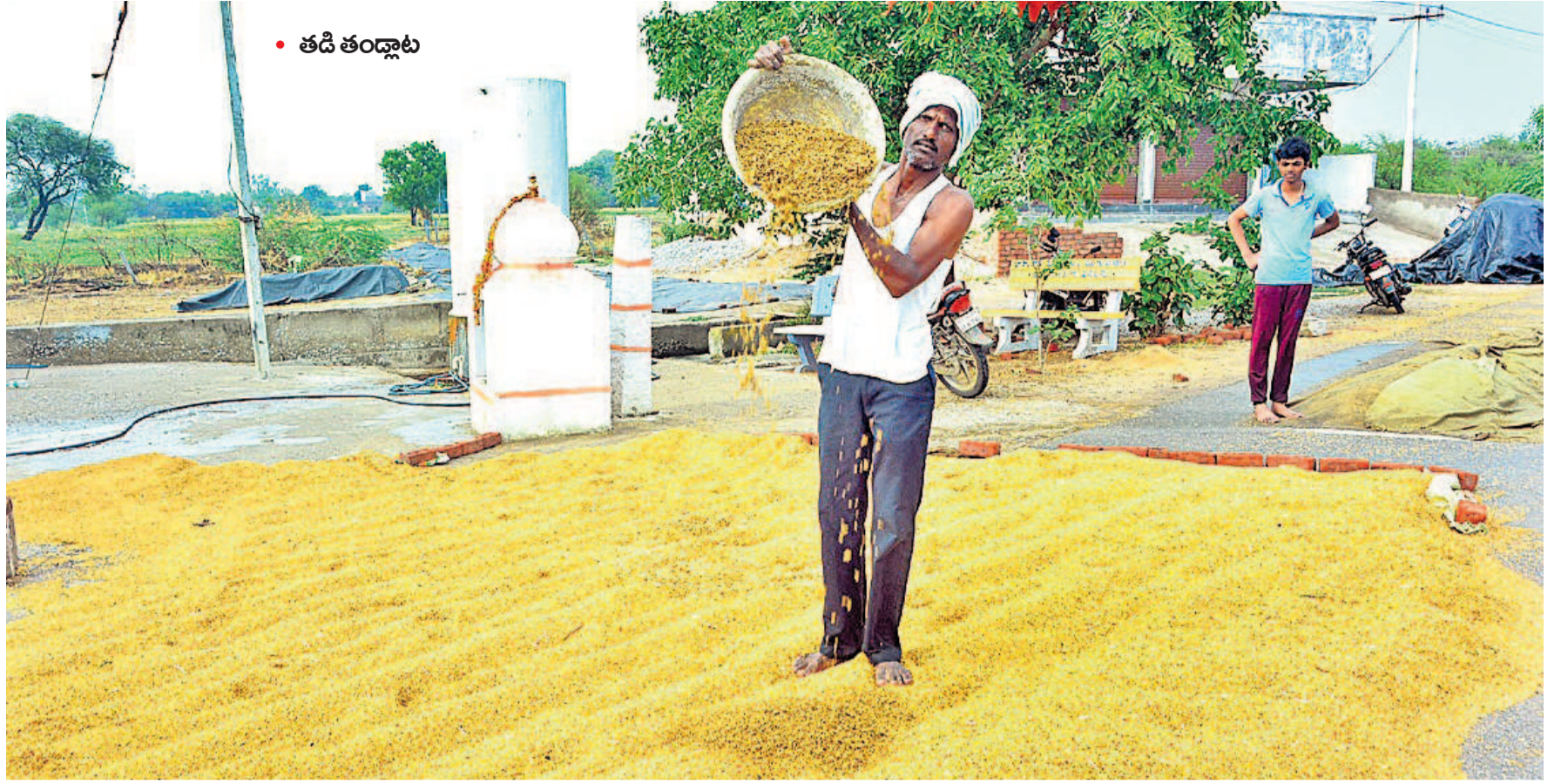
• తడి తండ్లాట