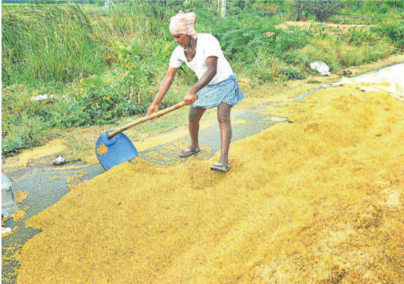
నంగారెడ్డి జిల్లాలో వర్షానికి కొట్టుకుపోయిన ధాన్యాన్ని కుప్ప చేస్తున్న రైతు