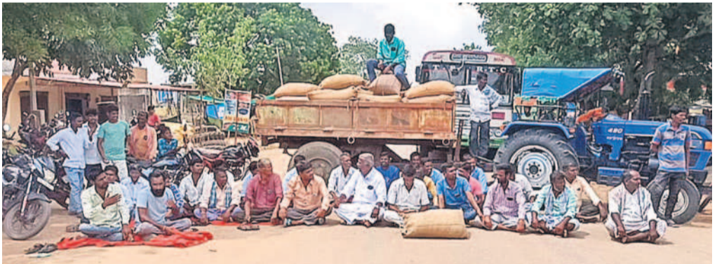
మెదక్ జిల్లా కొల్లూరం మండలం దుంపలకుంటలో ధాన్యం బస్సాలతో రాస్తారోకో చేస్తున్న రైతులు

అడిగి తెలుసుకోవాలని అన్నారు. కాంగ్రెస్ ప్రభుత్వం తీరును ఎండగట్టాలని కోరారు. వడ్డును కాంగ్రెస్ ఇస్తానన్న కాంగ్రెస్ ప్రభుత్వంపై రైతుల పక్షాన పోరాటం చేయాలని సూచించారు. రోజూ కొనుగోలు కేంద్రాలను మోసం చేస్తున్న కాంగ్రెస్ ప్రభుత్వం తీరును ఎండగట్టాలని కోరారు. వడ్డును కాంగ్రెస్ ఇస్తానన్న కాంగ్రెస్ ప్రభుత్వంపై రైతుల పక్షాన పోరాటం చేయాలని సూచించారు. రోజూ పొద్దున, సాయంత్రం కొనుగోలు కేంద్రాల వద్దకు వెళ్లాలి, అక్కడ రైతులతో మాట్లాడి సమస్యలను పరిష్కరించాలని కోరారు.