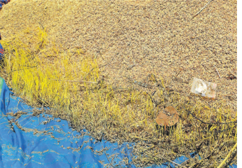
కామారెడ్డి జిల్లాలో ఆరబోసిన వడ్డుకు వచ్చిన మొలకలు