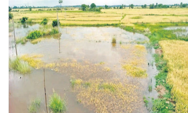
ఇయశంకర్ భూపాలపల్లి జిల్లా గణపూరం మండలం కేంద్రం శివారులో మోరంపాడు వాగు వరద నీటిలో మునిగిన వరి పొలం

నీరు వచ్చి చేరింది. మూడు రోజులుగా కురుస్తున్న భారీ వర్షాలకు ఇయశంకర్ భూపాలపల్లి జిల్లా గుణపురం మండలంలోని సీతారాం పురం, వెల్దుపల్లి గ్రామాల మధ్యలోని మోరంపాడు వాగు ఉధృతంగా ప్రవహిస్తున్నది. వాగు పరిసర ప్రాంతాల్లోని వరి పంట పొలాలు నీటి మునిగాయి. నేలవాలిన వరిపంట చేతి కండ్ దశలో నీటిలోనే మొలకెత్తడంతో రైతులు ఆందోళన చెందుతున్నారు. మరో 20 రోజుల్లో కోతలు పూర్తి చేసి ధాన్యాన్ని విక్రయించే సమయంలో వర్షాలు తమ పాలిట శాపంగా మారాయని రైతులు ఆవేదన వ్యక్తం చేస్తున్నారు. గణపూరం మండలం కేంద్రంలోపాటు కొండాపూర్, ధర్మారావుపేట, నగరంపల్లి, చెల్లూర్, బుద్ధారం, మైలారంలో పంట నీటి మునగడంతో రైతులకు కొలెని దెబ్బ తగిలింది.