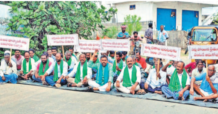
జగిత్యాల జిల్లా నర్సంపాలపల్లిలో ధర్మా చేస్తున్న బీఆర్ఎస్ నాయకులు, రైతులు