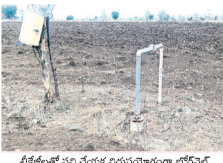
లీకేజీలతో పని చేయకు నిరుపయోగంగా బోరివెల్

నర్సారాజ్(జి), మే 18: సాయిగర్ తండాలో తాగునీరు లేక గ్రామస్థులు ఇబ్బందులు పడుతున్నారు. గ్రామ పరిసరాల్లో వేసిన బోరివెల్ల పైపుల లీకేజీలతో రెండు నెలలుగా తాగునీరు అందడం లేదు. మిషన్ భగీరథ నల్లల ద్వారా వస్తున్న నీరు తాగునీరు అనువుగా లేదని తాగునీటి కోసం అలయంలో ఉన్న బోరి నుంచి తీసుకెళ్తామని మహిళలు ఆవేదన వ్యక్తం చేస్తున్నారు. ప్రభుత్వం గ్రామంలో నీటి ఎద్దడి లేకుండా చూడాలని ఆదేశిస్తున్న అధికారులు పట్టించుకోవడం లేదు. ఇకనైనా సంబంధిత అధికారులు స్పందించి తాగునీరు అందేలా చర్యలు తీసుకోవాలని గ్రామస్థులు కోరుతున్నారు.