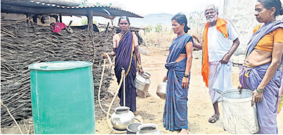
భగీరథ నీళ్లు వస్తేనేనే తెలుపుతున్న మహిళలు

తాంసి, మే 18 : వేపవి మొదల కావడంతో తాంసి మండలం పాలోడి గ్రామంలో తాగునీటి కష్టాలు మొదలయ్యాయి. గ్రామంలో మిషన్ భగీరథ నీరు రాక ప్రజలు కష్టాలు పడుతున్నారు. వారంలో మూడు రోజులు భగీరథ నీరు వస్తున్నదని, ఒక రోజు వస్తే మరో రెండు రోజులు భగీరథ నీరు రావడం లేదు. భగీరథ నీరు సరఫరా కాని రోజు తాగునీటితో పాటు నిత్యావసరాలకు నీరు లేకపోవడంతో ప్రజలు ఇబ్బందులు పడుతున్నారు. మిషన్ భగీరథ నీళ్లు క్రమం తప్పకుండా ప్రతి రోజు విడుదల చేయాలని గ్రామస్థులు కోరుతున్నారు. సంబంధిత అధికారులు వెంటనే తగు చర్యలు తీసుకోకుంటే జిల్లా కలెక్టర్ దృష్టికి తమ సమస్యలు తీసుకెళ్తామని తెలిపారు.