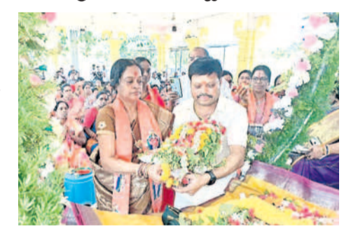
పూజలు చేస్తున్న భక్తులు