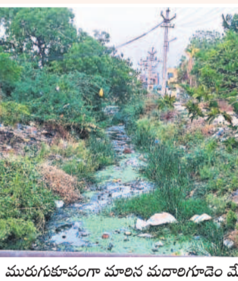
మురుగుకూడంగా మారిన మదాలిగూడెం మేజర్ కాలువ

హాలియా, మే 17: హాలియా గుండా ప్రవహించే మదాలిగూడెం మేజర్ పంట కాలనీ మురుగు కాలువలు తలపిస్తుంది. ఇండ్ల నుంచి వచ్చే వ్యర్థాలతో పాటు చెవలపట్టు, చిక్కిన వ్యర్థం అంతా ఈ డ్రైనేజీ కాలువలోనే వేస్తుండడంతో మురుగు కాలువలు తలపిస్తుంది. గతంలో బీఆర్ఎస్ పాలనలో మదాలిగూడెం మేజర్ కాలువల ఇరువైపులా గోడలు కట్టి పై కప్పు వేసి కూరగాయల మార్కెట్ నిర్మించాలని భావించారు. కానీ దురదృష్టవశాత్తు నోముల నర్సింహయ్య మరణం తరువాత ఈ కాలువల గురించి అంతా మరిచిపోయారు. మేజర్ కాలువల ఇరువైపుల, ఇంట్లో నుంచి వ్యర్థాలతో పాటు చెవలపట్టు, చిక్కిన వ్యర్థం అంతా ఈ డ్రైనేజీ కాలువలోనే వేస్తుండడంతో మురుగు కాలువలు తలపిస్తుంది. గతంలో బీఆర్ఎస్ పాలనలో మదాలిగూడెం మేజర్ కాలువల ఇరువైపులా గోడలు కట్టి పై కప్పు వేసి కూరగాయల మార్కెట్ నిర్మించాలని భావించారు. కానీ దురదృష్టవశాత్తు నోముల నర్సింహయ్య మరణం తరువాత ఈ కాలువల గురించి అంతా మరిచిపోయారు.