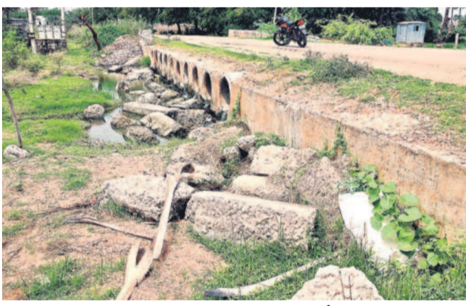
వరద తాకిడికి కూలిన కల్వర్లు రక్షణ గోడ