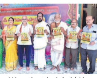
శ్రీభగవత్ సప్తహం కరవత్రాణం ఆవిష్కరణ ప్రవచకులు