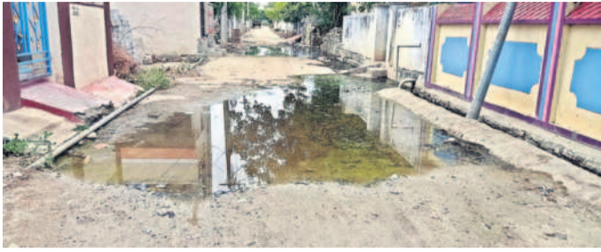
మండల కేంద్రంలోని త్రాగునీటి బోరు వెంట నిలిచిన మురుగునీరు

• సర్వీస్ రోడ్డు వేసేదెన్నడో.. సమస్య తీరదెప్పడో..!