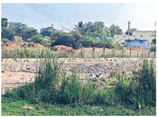
నీరు లేక బోసిపోయిన తుమ్మడం చిన్న చెరువు అలుగు

భయాందోళనలో ప్రయాణికులు రద్దీ వెళ్తున్న సమయంలో రెండు వాహనాలు ఎదురుదాటగా వచ్చిన సమయంలో ఎప్పుడు ఏ ప్రమాదం జరుగుతుందోనని ప్రయాణికులు, ప్రజలు ఆందోళన చెందుతున్నారు. రాత్రి సమయంలో పాహన దారులు ప్రాణాలు ఆరచేతిలో పెట్టుకొని ప్రయాణి చాలి వస్తామని భయాందోళన చెందుతున్నారు. అధికారులు స్పందించి కల్వర్లకు మరమ్మత్తులు చేయించి రహదారికి ఇరువైపుల రక్షణగోడ నిర్మించాలని ప్రయాణికులు, ప్రజలు కోరుతున్నారు.