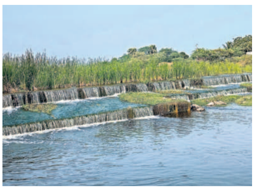
మాడు నెలల క్రితం అలుగు పోన్నట్లు చెరువు అలుగు (ఫైల్)