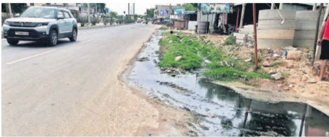
రోడ్డువెంట ఉన్న కాలుషీల ఇండ్ల ముందు నిలిచిన డ్రైనేజీ నీరు

పోవడంతో ఇబ్బందిగా మారింది. వర్షం పడితే చాలు నీరంతా ఇళ్లు, రోడ్డుపైకి పారుతుండడంతో కాలుషీలు అప్యాయ పడుతున్నారు. ప్రస్తుతం మండల కేంద్రంలో కొత్తగా నీటి రోడ్డు వేసినప్పటికీ డ్రైనేజీలు లేక పోవడంతో ఇబ్బందులు అధికమయ్యాయి. కొన్ని కాలుషీల డ్రైనేజీలు నిర్మాణం చేసినా అందులో నీరు ఎక్కడకు వెళ్తో తెలియక నిలిచిపోయి దుర్బంధం వెలుబిల్లుతుంది. అధికారులు స్పందించి వెంటనే డ్రైనేజీ వ్యవస్థ ఏర్పాటు చేయాలని కోరుతున్నారు.