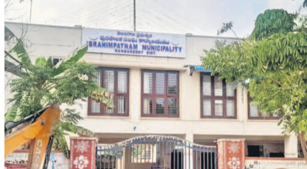
ఇబ్రహీంపట్నం మున్సిపల్ కార్యాలయం